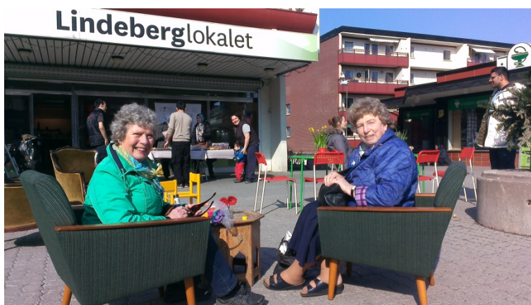
Lindeberglokalet er områdeløft Lindebergs kontor på Lindeberg senter. Lokalet benyttes av de som bor på Lindeberg til åpne møter og arrangementer drevet på frivillig basis.

Stedsidentitet vil alltid være problematisk å måle som resultat av en satsing, fordi befolkningens tilknytning til eget nærmiljø og bosted handler om beboeres interesser og preferanser uavhengig av prosjekter som settes i gang. For noen er nærmiljøet og stedet der man bor viktig for trivsel og livskvalitet, og fungerer som en identitetsmarkør relatert til andre steder; ”Vi som bor her” (Vestby og Johannessen 2010). For andre betyr bostedet lite fordi man har nettverket og fritiden utenfor, og er i mindre grad interessert i det som skjer i nærmiljøet. Samtidig kan man være knyttet til et sted og trives godt uten å være aktiv med i miljøet.