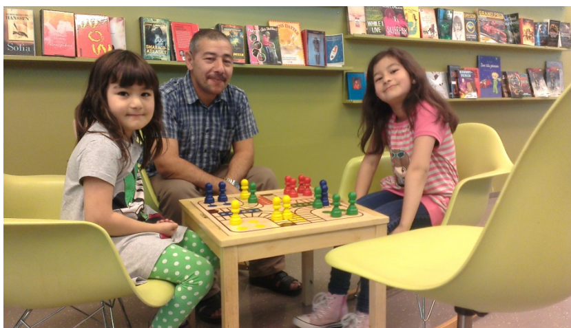
Fra Lindeberglørdag.

Lindeberglørdag er åpent en gang i måneden og svarene vil følgelig gjenspeile tilsvarende hyppighet på bruk. At Lindeberglokalet ikke benyttes ofte er i stor grad i tråd med intensjonene om at lokalet kan benyttes for å stikke innom ved behov. Med disse refleksjonene viser svarene i denne oversikten en positiv tendens.