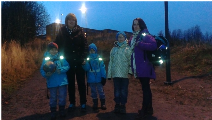
Gangveien mellom Lindebergåsen og Jeriko skole har fått ny belysning etter initiativ fra beboerne på Lindberg.