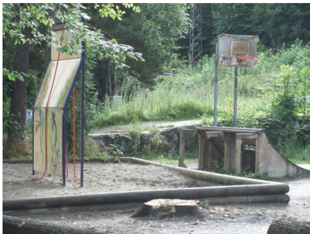
Lekeplassen på Skjønnehaug skole før oppgradering.

sjelden eller aldri benytter seg av stedet. Ballbanen på Skjønnehaug skole brukes kun av noen få, mens 4 av 5 svarer at de sjelden eller aldri er der. Nordre Lindeberg gård besøkes i noe større grad av informantene. 1 av 3 svarer at de er der ofte eller svært ofte.