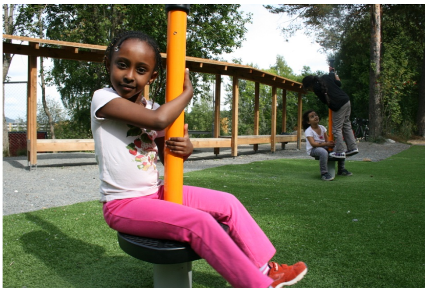
Lekeplassen på Skjønnehaug skole etter oppgradering. Plassen har kunstgress, forballmål, landhockeymål, basketkurv og lekeplass.