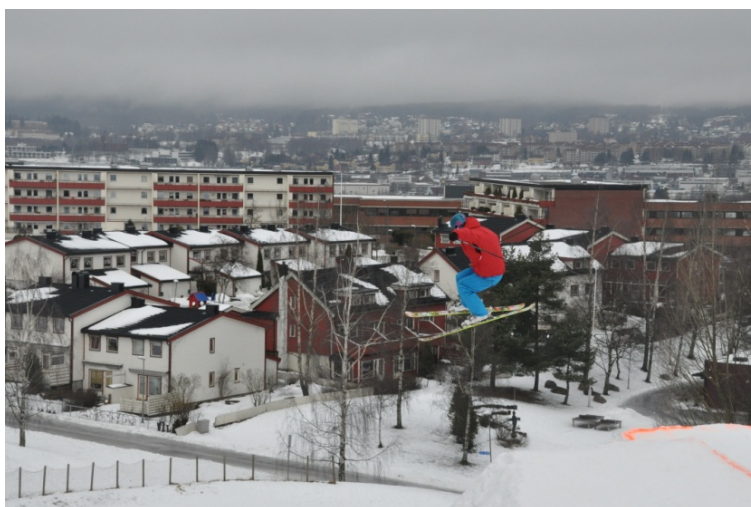
Fra Jerikobakken.

Sammenlignet med svarene i denne undersøkelsen scorer Lindeberg svært høyt på beboernes tilfredshet med oppvekstmiljøet for ungdom.