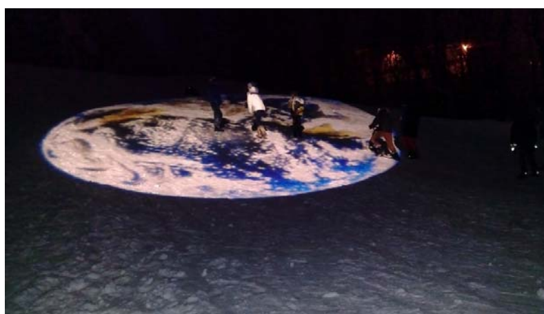
Midlertidig lyskunst bidro til mer lys og engasjement fra alle 6. klassene på Lindeberg i påvente av den permanente belysningen på gangveien ved Jerikobakken.