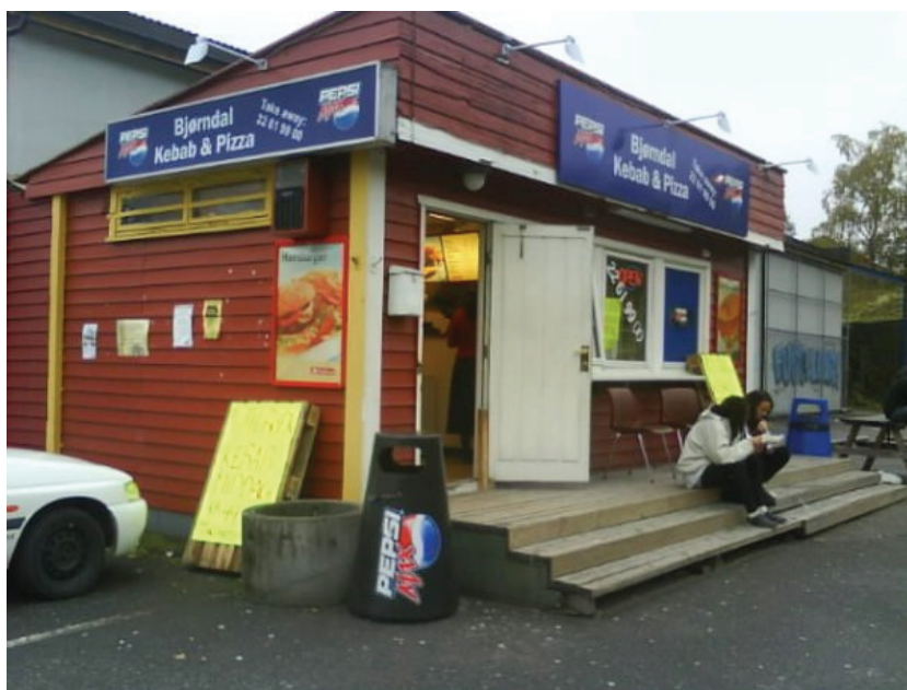
Figur 3.7 Bjørndal kebab og pizza, ikke langt unna Bjørnbolt skole

Sørøst for området planlegges en dagligvareforretning for REMA og et nybygg for Orring Byggsenter med kontor, forretning og lager. Det skal også opparbeides en plass ved butikken på minst 100 m 2 som skal være tilgjengelig for alle.