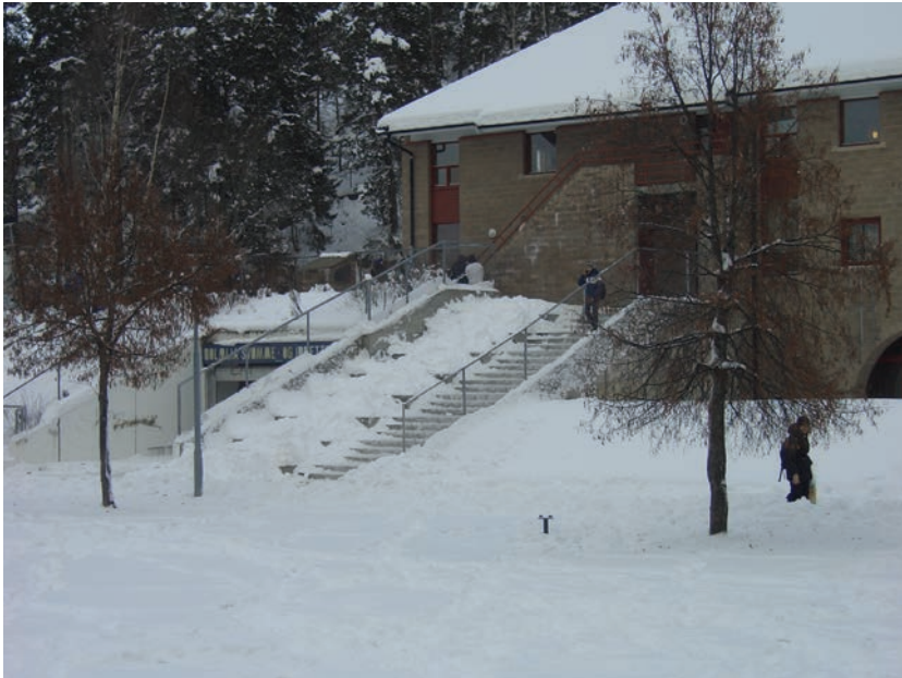
Figur 5.6 Holmlia ungdomsskole med trappeanlegget ned til friområdet. Inngangen til fjellballen inntil skolen.

Beboermøtet diskuterte muligheten for å bruke skolens innendørs fellesrom som møteplass på kveldstid. Erfaringer fra tidligere forsøk har vist at det er vanskelig å bruke klasserommene. Dette på grunn av informasjon om elever i klasserommene, klasserommets orden, elevens eiendeler, renhold m.m. Man mente imidlertid det burde vært mulig å bruke skolens forsamlingsrom, der det ofte er teaterscene og annet utstyr. Holmlia skole har for eksempel samlingssal med scene og kafé, som eventuelt kunne tas i bruk som arena for konsert- og kulturarrangementer.