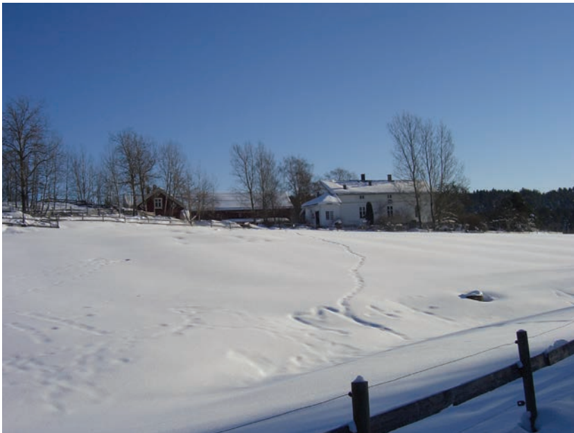
Figur 5.8 Søndre Ås gård ligger vakkert til helt sør på Holmlia. Gårdens tilbud benyttes av beboere fra hele bydelen

gården også fungerer som besøksgård. Det er i tillegg etablert en lavvo der. Det var ingen av ungdommene i vår 9.klasse på Holmlia skole som nevnte Søndre Ås gård, men fra beboermøter i andre delbydeler, er det en del andre jenter som har omtalt ridesenteret som et viktig møtested.