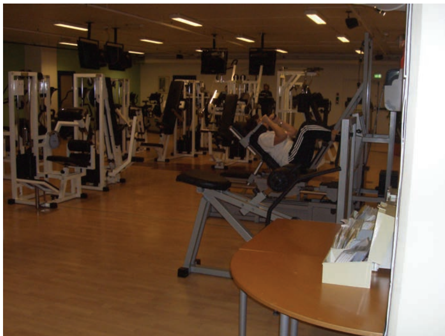
Figur 6.3 Det private treningssenteret er meget godt besøkt

Klemetsrudhallen har inngang fra en tilkjøringsvei mellom garasjeanlegget og senteret. Inngangspartiet er nedslitt og lite innbydende. En lang korridor og et stort trappanlegg må forseres for å komme til bruksarealene. Atkomstarealene kunne med fordel vært utnyttet bedre og gjort mer innbydende. Daglig leder av treningssenteret etterlyser oppussing og oppgradering av inngangspartiet. Ansvarsforholdene når det gjelder drift og vedlikehold, virker imidlertid uklare. Det vil være delte meninger om et møtested her er ønsket, men trapperommet brukes mye i dag, først og fremst av skoleelever som sted å spise skolemat.