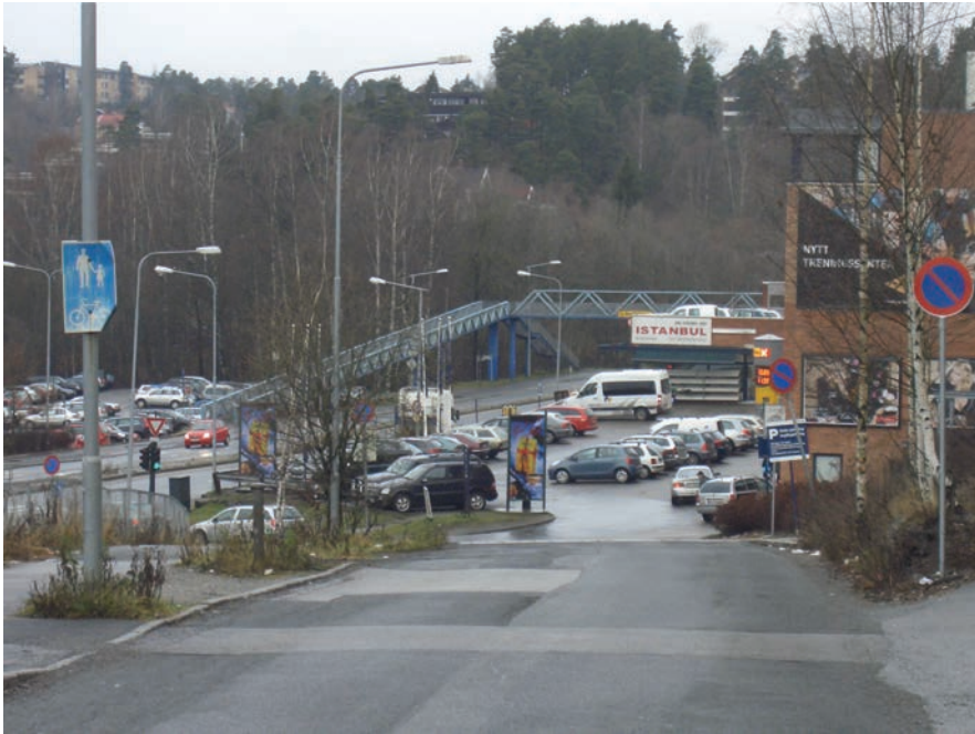
Figur 4.8 Hauketoveien, sett mot stasjonsområdet. "Trekanten" til venstre i bildet