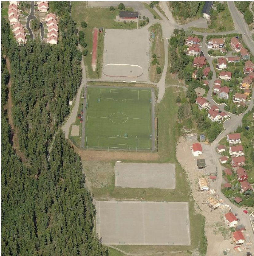
Figur 3.4 Meklenborg idrettsanlegg ligger i en dalsenkning mellom bebyggelsen og Grønliåsen

I grenseområdet mellom bebyggelsen på Bjørndal og Grønliåsen ligger Meklenborg idrettsanlegg. Det er et relativt stort anlegg, med to fotballbaner, en med grus og en med kunstgress, to tennisbaner, en ballbinge og flere mindre grusbaner. For vinteraktiviteter tilbyr området en mindre helårs hoppbakke og skøytebane. Området har også en skaterampe og et klubbhus som rommer en rekke aktiviteter for barn og ungdom. Klubben driver også en utlånsentral hvor det lånes ut sportsutstyr. Slik idrettsanlegget drives, fungerer det som helårs møtested både inne og ute. I tillegg er området et viktig utfartssted for turer i Grønliåsen både sommer og vinter.