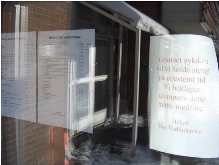
Figur 5.9 Søndre Holmlia fritidscenter er stengt på ubestemt tid.

Det virker som om det er mange ungdommer som møtes der, og at man har dette som møtested hele året. Det er et ”etter skoletid tilbud” for de yngste elevene og åpent for ungdom en kveld i uka i tillegg til de som driver med ulike aktiviteter som film, dans, musikk. På beboermøtet kom det fram at driften har vært ustabil. Da vi var på befaring i februar, var den midlertidig stengt.