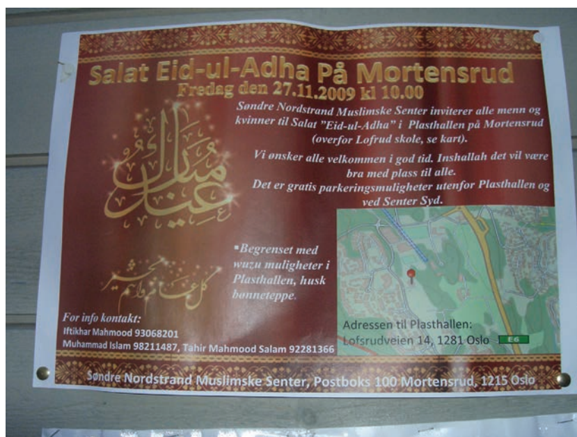
Figur 6.7 Søndre Nordstrand Muslimske senter var et viktig møtested, inntil det ble nedlagt vinteren 2010

Det kom frem på beboermøtet at det har vært noen misforståelser omkring bruken av brakkene idet noen innvandregrupper hadde følt seg utestengt fra bruken av brakkene. Man forsøkte å klare opp i dette på møtet.