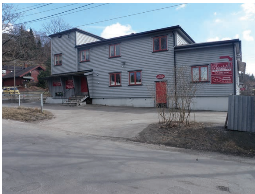
Figur 4.6 Prinsdal velhus, en litt anonym bygning som rommer et flott møtelokale

Velhuset ligger ved Prinsdal torg. Det er totalrenovert innvendig etter en brann og framstår nå med attraktive lokaler. Velhuset har en stor innendørs sal som kan deles i to, og nytt kjøkken. Velhuset drives av Lions på kommersiell basis. En relativt høy leie utelukker trolig en rekke potensielle brukere. Antagelig brukes stedet først og fremst til private selskap.