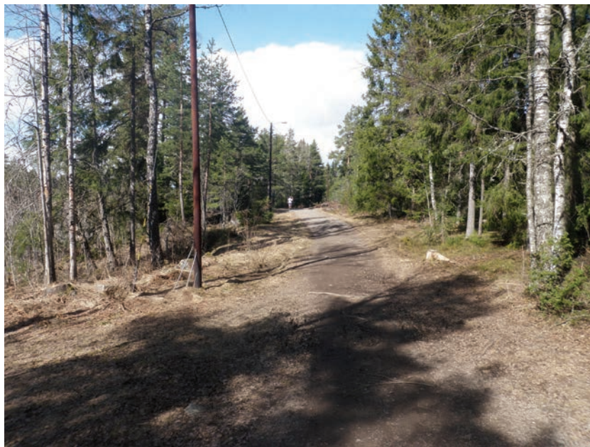
Figur 3.8 Gronliåsen er et flott rekreasjonsområde med hysløype