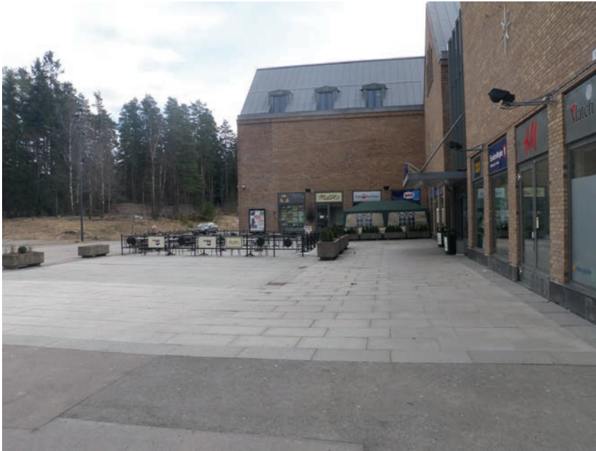
Figur 6.11 Torget på Senter Syd er i dag en ødslig og lite brukt plass