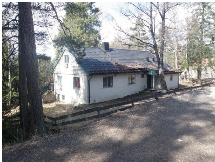
Figur 6.8 Stenhuset har potensial til å bli et viktig møtested. Bygningen trenger vedlikehold og innvendig modernisering

Stenhuset drives av Søndre Nordstrand Innvandrereforening og er et viktig innendørs møtested for mange grupper, spesielt tyrkiske kvinner og barn og en del eldre som bruker stedet. Bygningen eies av Oslo kommune og har tidligere vært barnehage. Bygningen er en tidligere enebolig som ligger lett tilgjengelig fra gangveien over Mortensrudveien. Det er åpent dag og kveld hele året, 2 til 3 ganger i uka, og det tilbys dataundervisning, engelskkurs, leksehjelp m.m.