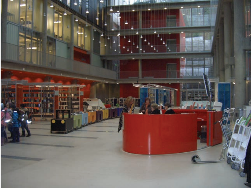
Figur 3.3 Biblioteket i Bjørnholt skole er filial av Deichmanske bibliotek og betjener offentligheten

Utendørs byr skoleanlegget på basket- og sandvolleyballbane, utendørs bordtennis, leke- og skateanlegg.