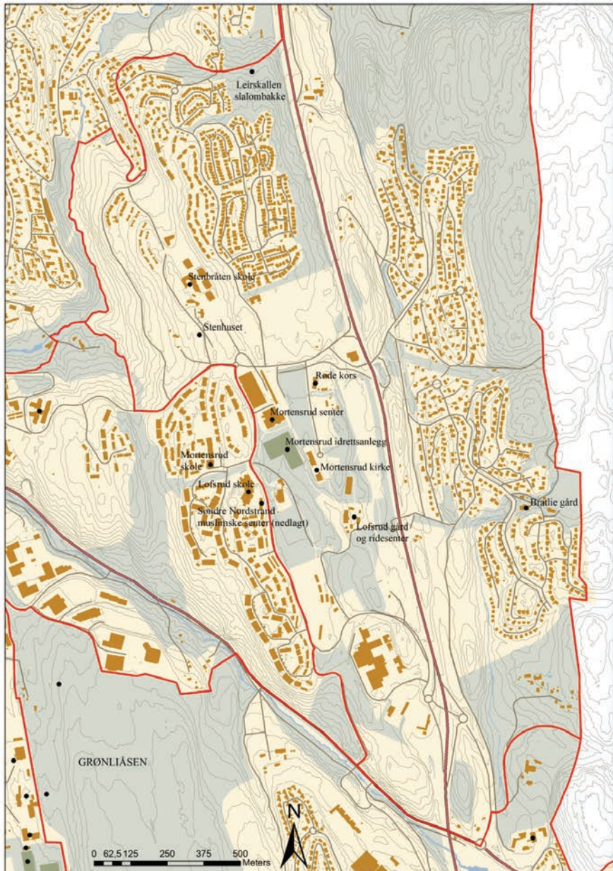
Figur 6.1 Møtesteder på Mortensrud