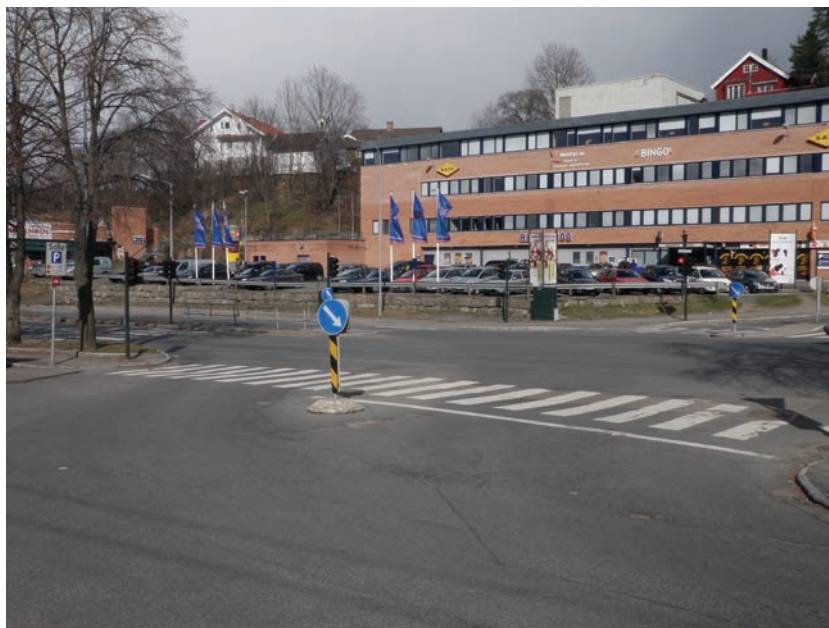
Figur 4.4 Hauketo senter er dominert av trafikkfunksjoner

Hauketo er et knutepunkt for kollektivtrafikken med overgang fra tog til matebusser til boligområdene rundt. På denne bakgrunnen er området utpekt til et sentralt område for knutepunktutvikling i kommuneplanen for Oslo 2008 - 2025. Slik senteret framstår i dag, reflekteres ikke betydningen som bydelens mest sentrale sted. Senteret er en stor parkeringsplass omgitt av større næringsbygg. Senteret har et begrenset butikktilbud med en større dagligvare- og en grønnsaksbutikk. I dagligvarebutikken er det en liten krok med kafé og enkel servering. I etasjene over er det treningssenter og bingo.