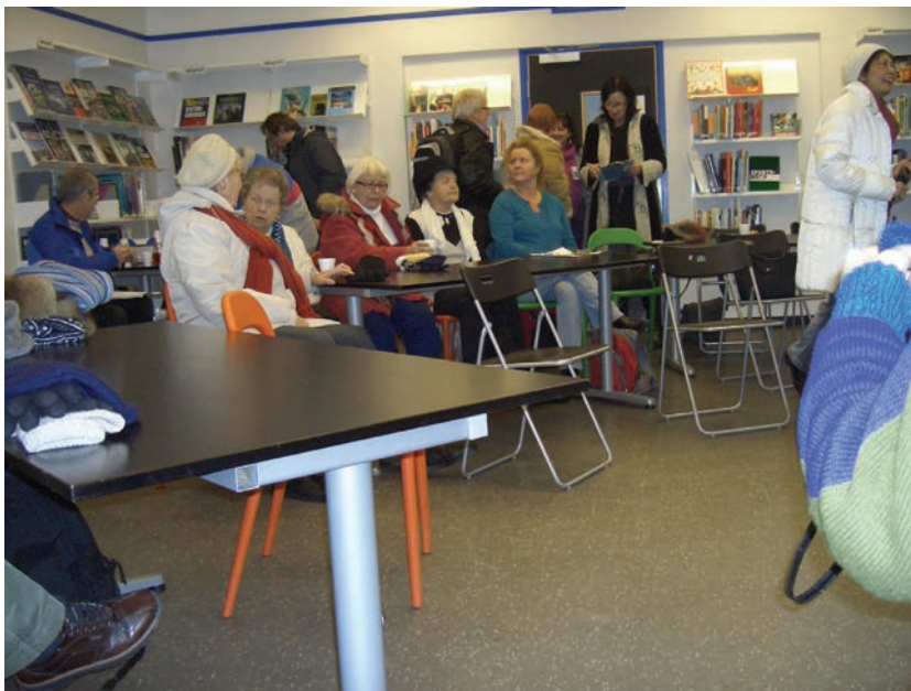
Figur 5.4 Biblioteket brukt som lokalt informasjons- og møtested

Biblioteket står, sammen med Holmlia kirke, bak et beboernetverk som heter ”Treffpunkt Holmlia”. En gang i måneden er alle beboere invitert til et treffpunkt, ofte med litteratur, musikk eller andre kulturtilbud. En gang i året arrangerer ”Treffpunkt Holmlia” konserten ”United”, hvor ”alle” er med.