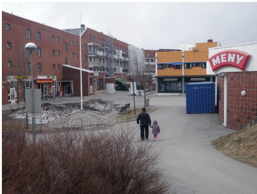
Figur 5.3 Holmlia senter med plassen foran Kafé Larsen

Det slår oss som underlig at ingen har omtalt denne plassen, til tross for at det er et ganske stort sørvendt og hyggelig torg. Torget har imidlertid sparsom møblering. Kaféieren fortalte at plassen tidligere ble brukt av ungdom til skating og sykling, men at det ikke er tillatt nå. Det foregår kjøring inne på plassen, med varelevering blant annet til dagligvarehandelen og flere omtaler dette som et problem.