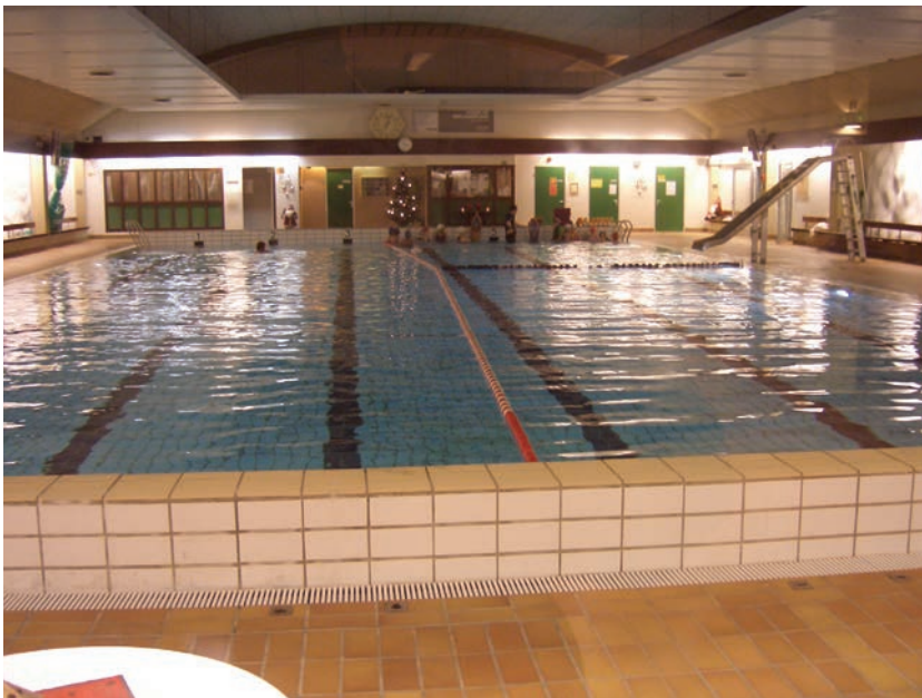
Figur 5.5 Holmlia svømmehall omtales, sammen med idrettshallen vis a vis, som det viktigste møtestedet for ungdommen på Holmlia

For øvrig er det bemerkelsesverdig at så få informanter i de øvrige delbydelene omtalte Holmlia svømmehall som møtested, den eneste offentlig tilgjengelige svømmehallen i Oslo Sør. Det kan henge sammen med at brukere fra andre delbydeler sjeldnere treffer kjente når de bruker svømmehallen og derfor ikke tenker på den som møtested (det samme gjelder biblioteket på Holmlia). Det