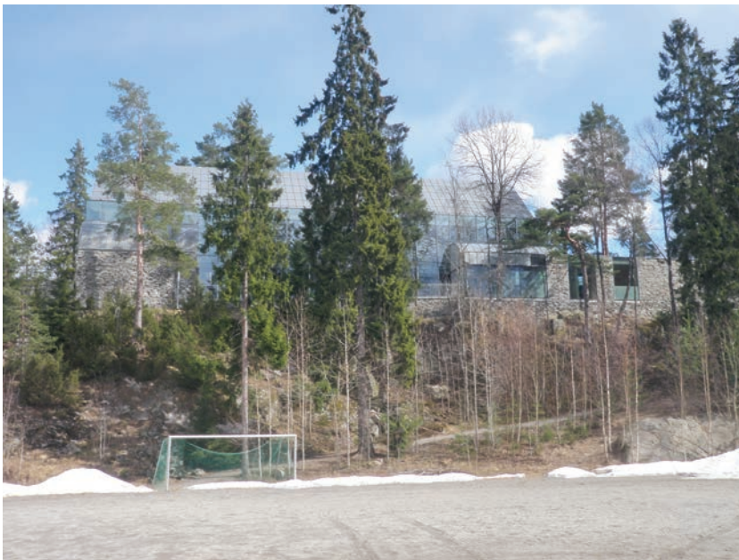
Figur 6.9 Mortensrud kirke ligger flott til, men litt avsondret fra senteret