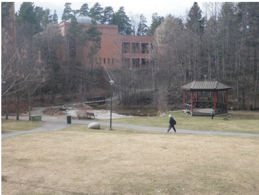
Figur 5.7 Parken nedenfor Holmlia senter er et av få parkmessige områder i bydelen, Holmlia kirke i bakgrunnen

Det er opparbeidet en bydelspark i omtrent samme område, med en liten dam, nedenfor kirken. Det er også plassert en rekke skulpturer i området og i tilknytning til gangveien. Det var få beboere eller ungdom som refererte til dette området, men noen ungdommer fortalte at de går tur, og BUT nevnte også gangveiene som steder ungdom møtes.