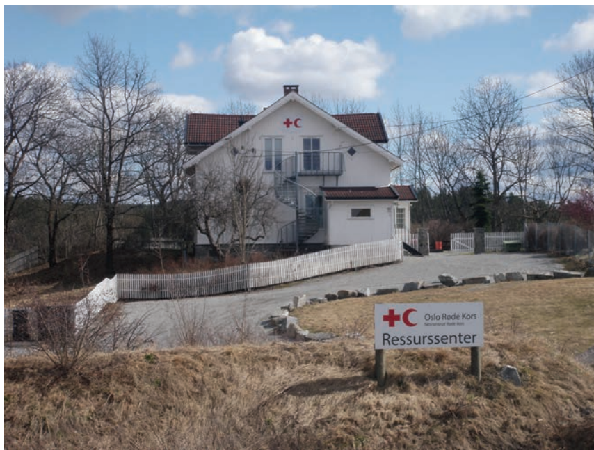
Figur 6.4 Røde kors ressurscenter har tilholds sted i tidligere Mortensrud gård like ved Senter Syd

med tilbud om leksehjelp, internett kafé, jentegruppe osv. De har lokaler i hovedbygningen på Mortensrud gård.