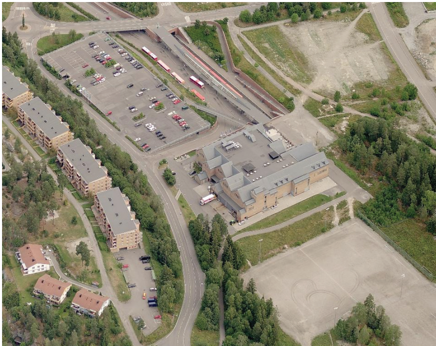
Figur 6.5 Oversiktsfoto Senter Syd. Torget ligger til høyre for senterbygningen og mangler funksjoner og menneskelig aktivitet.

Et torg er anlagt på østsiden i plan 2, men er lite brukt som møteplass. Hovedgrunnen til dette er at ingen naturlige atkomster til senteret skjer over torget. Inngangen fra T-banen vender mot nord og ligger en etasje lavere. Det er riktig nok trappeforbindelse fra T-banen og opp til torget, men de aller fleste foretrekker å gå rett inn i underetasjen i senteret. De som kommer med bil, parkerer i plan 1 eller 2 som begge har direkte forbindelse inn i senteret. Senteret har bare en vegg mot torget, de øvrige sidene av torget vender mot natur eller T-banestasjon. Dersom torget skal utvikles til en god møteplass, må det tilføres flere funksjoner og aktiviteter som tiltrekker seg mennesker.