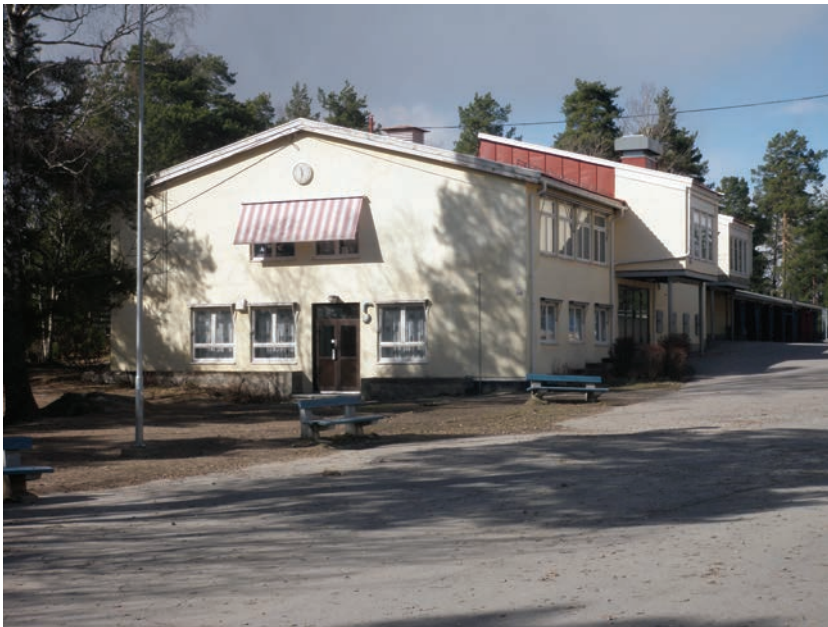
Figur 4.3 Prinsdal barneskole ligger fint til på vestsiden av Grønliåsen

Prinsdal barneskole og Hauketo ungdomsskole ligger inntil friområdet. Hauketo skole er ungdomsskole bygget i 1968 og nylig bygget på og utvidet. Skolen er et viktig møtested for ungdommen, både innendørs og utendørs hele året.