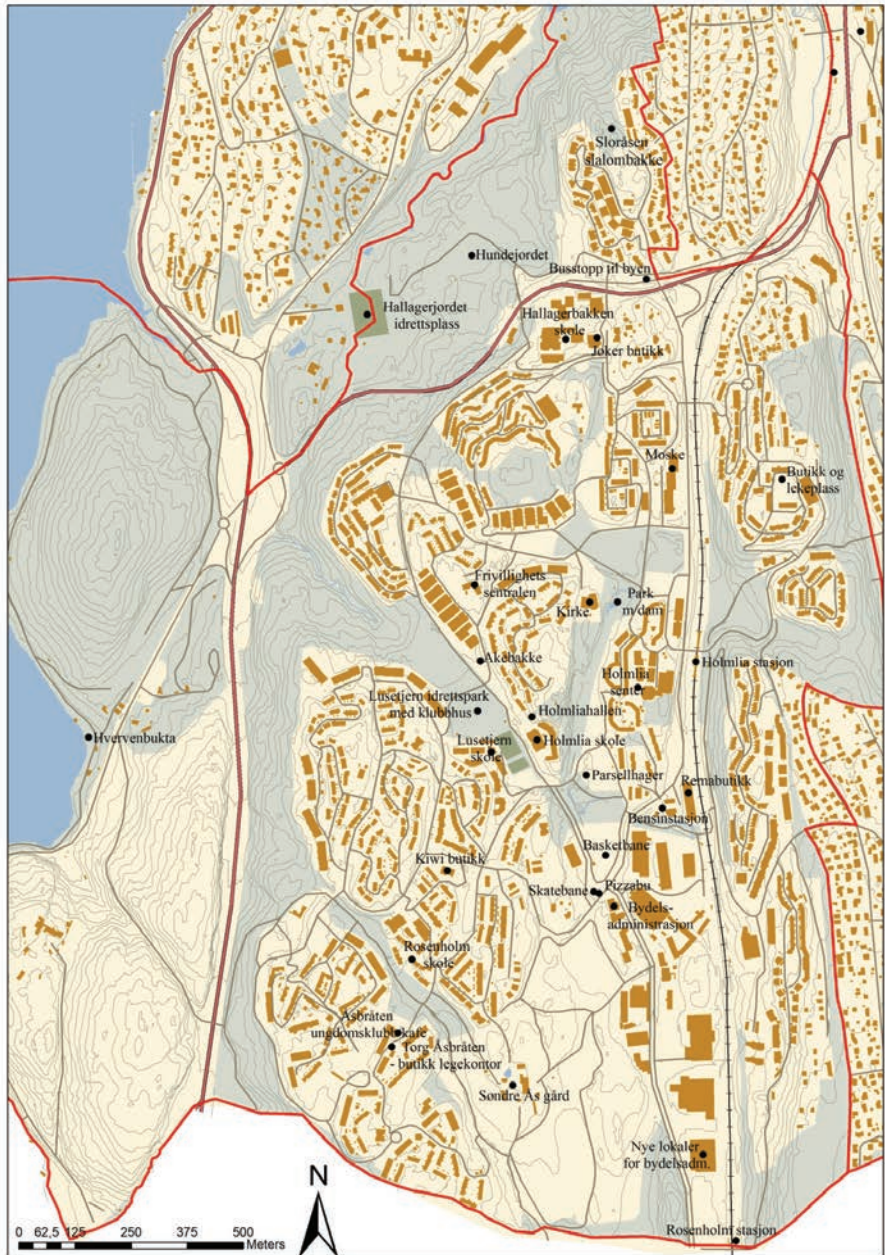
Figur 5.1 Møtesteder på Holmlia