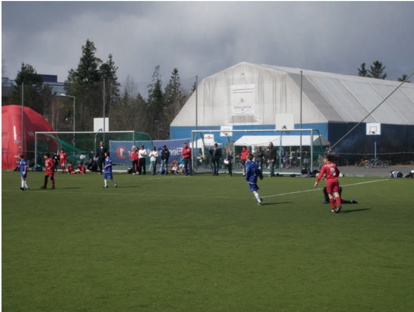
Figur 6.2 Mortensrud idrettspark er det viktigste utendørs møtestedet på Mortensrud