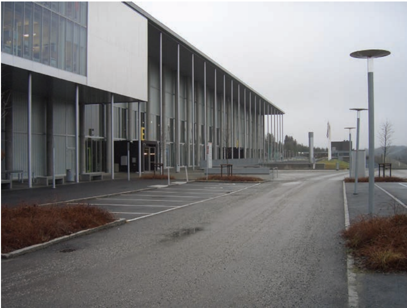
Figur 3.2 Bjørnholt skole er bydelens videregående skole. Et stortilt anlegg som stod ferdig i 2007

Skolen stod ferdig i 2007 og er en 8-13 skole med 1500 elever og 255 ansatte (2009). Den består av to separate bygninger, for ungdomstrinn og videregående. Ungdomsskolen ble tatt i bruk noen år tidligere. Skolens 28 000 kvadratmeter kan tilby blant annet 3 blackbox-scener, lydstudio, idrettshall m/klatrevegg, dansesaler, TV-studio, musikkrom, stor kantine med servering av varm og kald mat, internettkafé, fem store auditorier, byggehaller, Oslos største skolebibliotek, vringlearealer og forelesningssaler. Bjørnholt skole er Bydel Søndre Nordstrands eneste videregående skole og fungerer dermed som et møtested for ungdom fra hele bydelen. Deichmanske bibliotek avdeling Bjørnholt skole, det ene av bydelens to biblioteker, betjener både skolen og allmennheten og ligger sentralt i arealene for videregående. 2