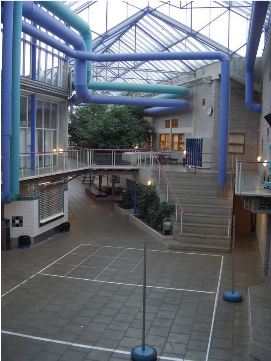
Figur 6.10 Det overdekkete sentralrommet i Mortensrud skole fungerer som elevenes møteplass og samlingsrom.

minst på grunn av løsningen med den sentrale glassoverdekkete gaten.