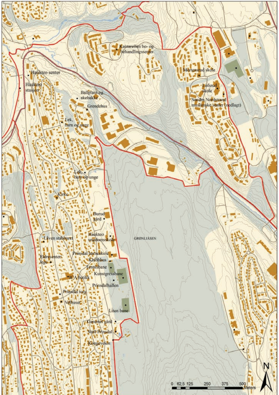
Figur 4.1 Møtesteder i Hanketo og Prinsdal