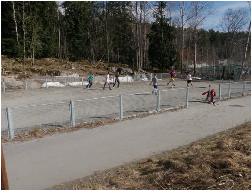
Figur 4.2 Litt av idrettsanlegget langs Grønliåsen

I grenseområdet mellom bebyggelsen og Marka er det anlagt fotballbinge, kunstgressbane og en idrettshall, Prinsdalshallen.