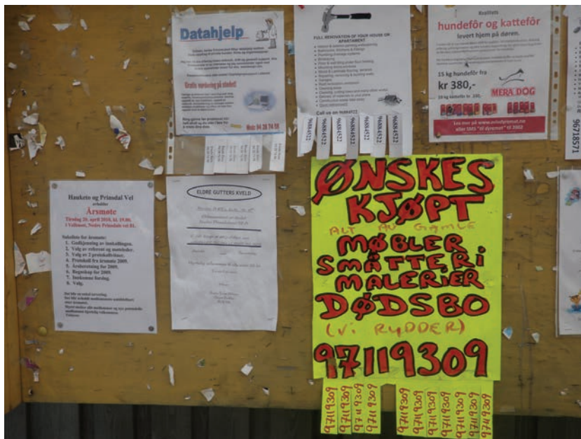
Figur 4.7 Oppslagstavla på Prinsdal senter

Det finnes en del møtesteder på Prinsdal/Hauketo som kan representere ressurser idet de kan tas i bruk i større grad enn hittil. Vi har omtalt Stabburet ved Låven. I tillegg ble Tennisklubbhuset nevnt som et møtested som brukes av medlemmer av tennisklubben, men som også leies ut til møter og selskap.