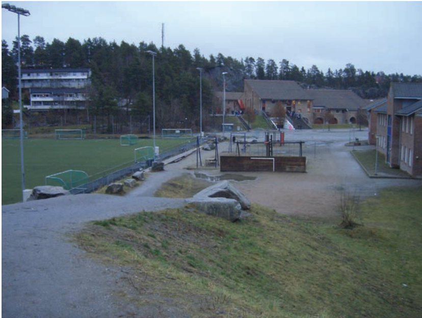
Figur 5.2 Lusetjern idrettspark, omtalt som Holmlias "hjerte"

Hallagerbakken, Toppåsen og Rosenholm, ifølge en informant fra Holmlia SK (mail 5.3.2010). Fotballbanen er det viktigste møtestedet for guttene, for å spille fotball eller bare for å møtes og prate. Jenter møtes også der, men få av dem spiller selv.