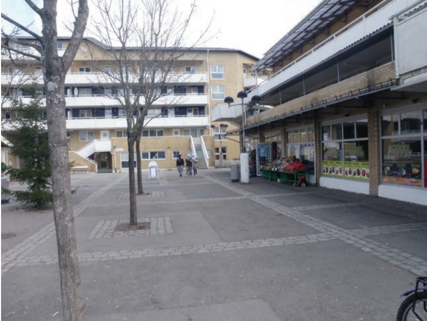
Figur 3.5 Bjørndal senter er mye brukt av ungdommen, men karakteriseres som "goldt og trist"