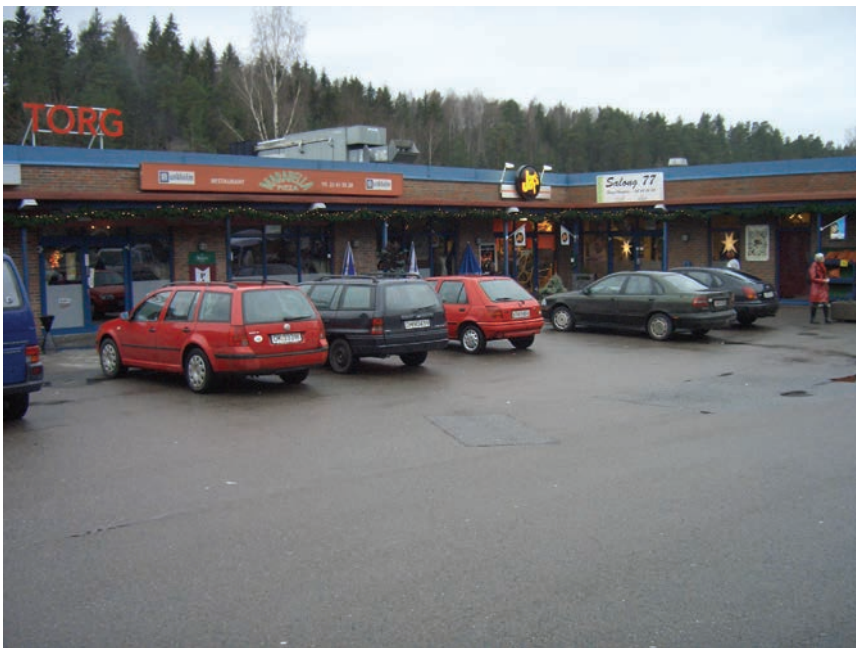
Figur 4.5 Prinsdal torg er dominert av parkerte biler og asfalt

Prinsdal torg ligger langs Nedre Prinsdalsvei en snau kilometer fra bygrensen. Mot veien har senteret en liten plass som stort sett er brukt til parkering. Ved plassen ligger det bl.a. en matvarebutikk, en grønnsakshandel, en kafé og et legekontor. Det er også en klesbutikk i bygningen ved siden av. Prinsdal Velforening har lokaler i Velhuset. Det er også noen butikker og enkle kafeer på den andre siden av Nedre Prinsdalsvei.