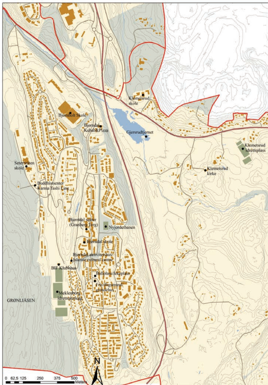
Figur 3.1 Møtesteder på Bjørndal