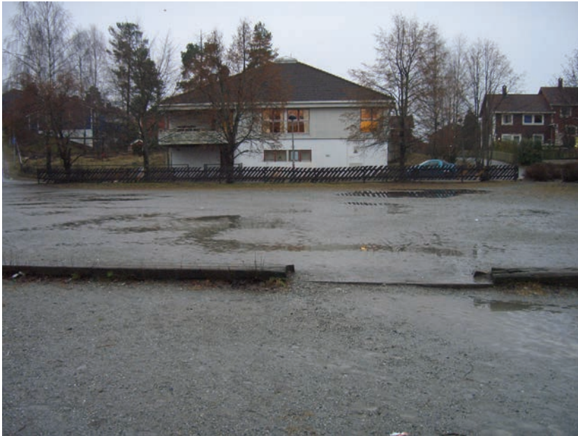
Figur 3.6 Frivilligsentralen og plassen foran i novemberregn