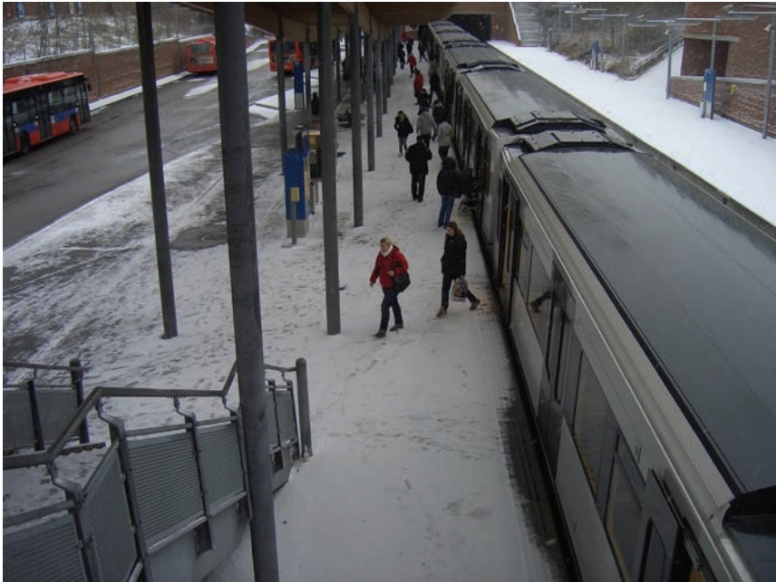
Figur 6.6 T-banestasjonen på Mortensrud med trappa opp til torget

Det foreligger planer om utvidelse av Senter Syd med flere butikker og tilbygg.