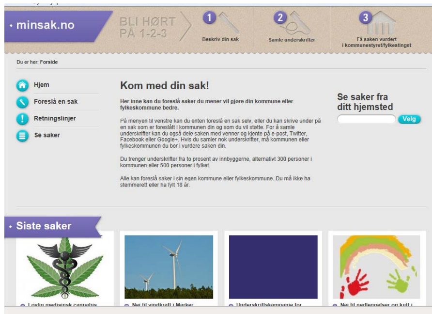
Figur 7.1 Startsiden på http://www.minsak.no