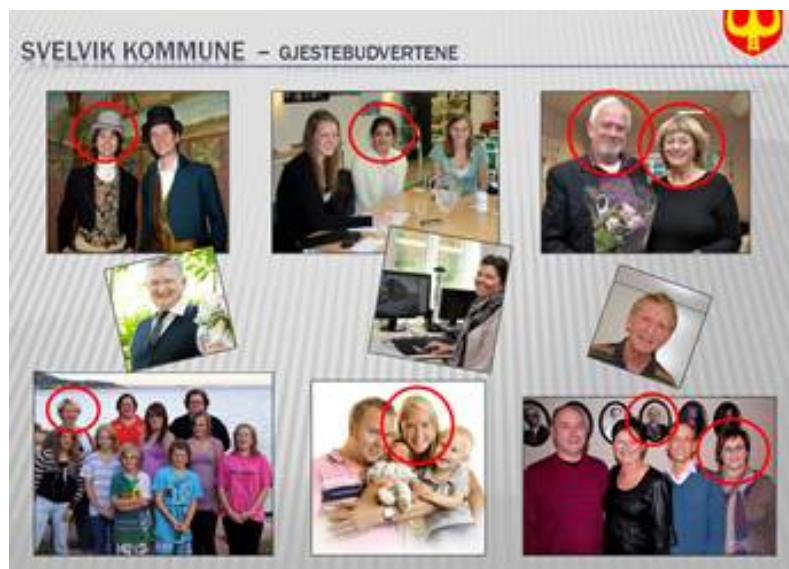
Figur 6.1 Eksempler på gjestebudverter

Ved hjelp av gjestebudsmodellen fikk kommunen inn innspill fra et spekter av innbyggere som ellers ikke ville fått frem sine meninger i slike prosesser. Innspillene ble integrert i planen, ved at de ble brukt for å utforme overordnede mål og delmål i kommuneplanens samfunnsdel – som for eksempel gjaldt hvor man skulle satse på nye bo- og utbyggingsområder.