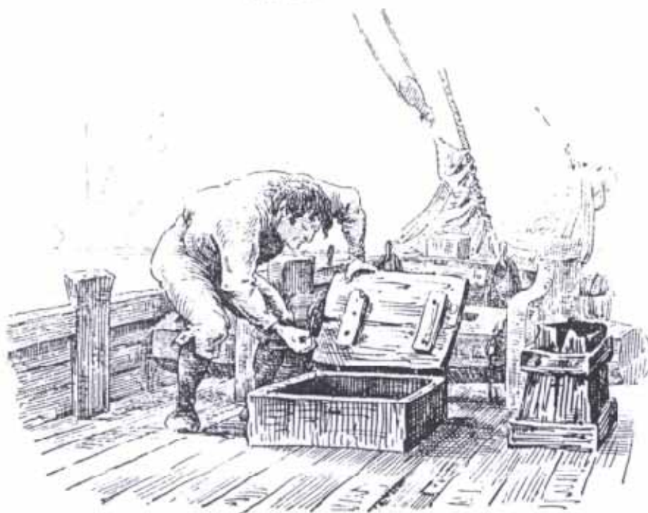
Nº I. "Ola da, vil Du naa bære see aa tórur ud. Din Døstlunge - Klokka er allí sver fire!"