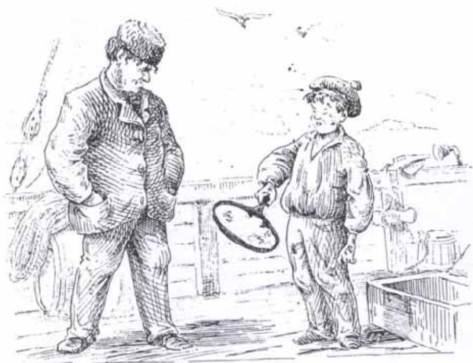
Nº VI. Ola som Kokk.