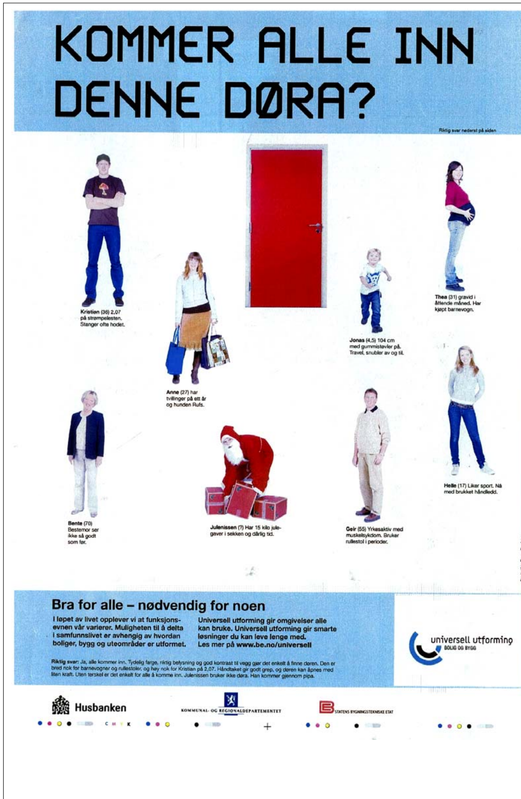
Figur 2.2 Husbanken, Kommunal- og regionaldepartementet og Byggeteknisk Etats annonse i kampanjen «Ingen Hindring».