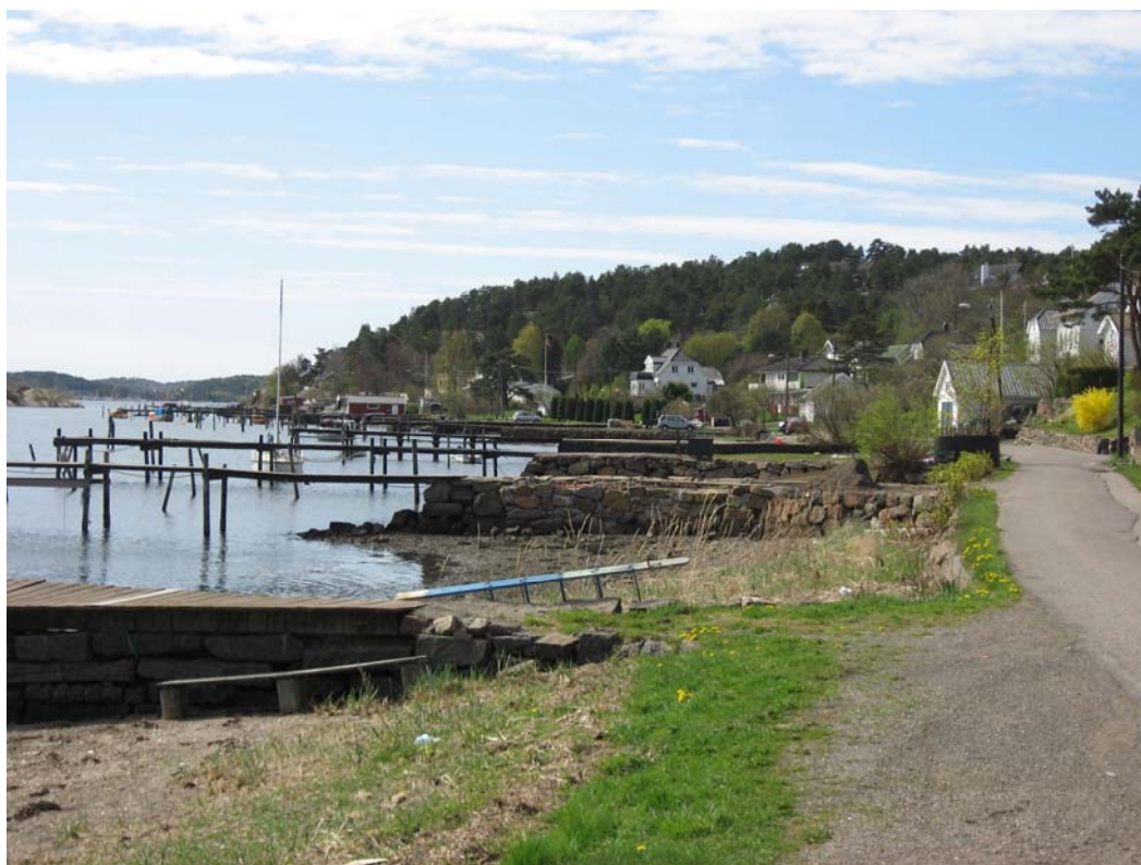
Figur 4.2 Bilde av Middelborg med de karakteristiske bryggene

De fleste av de opprinnelige strandsitterhusene brukes fortsatt som bolig på helårsbasis, i følge informanter. Det er en imidlertid generell trend at flere hus i denne type bebyggelse brukes som fritidsboliger. En rapport fra kommunen fra 2002 viser at jo nærmere sjøen en bolig ligger dess større interesse er det for utenbygdsboende å bruke denne som