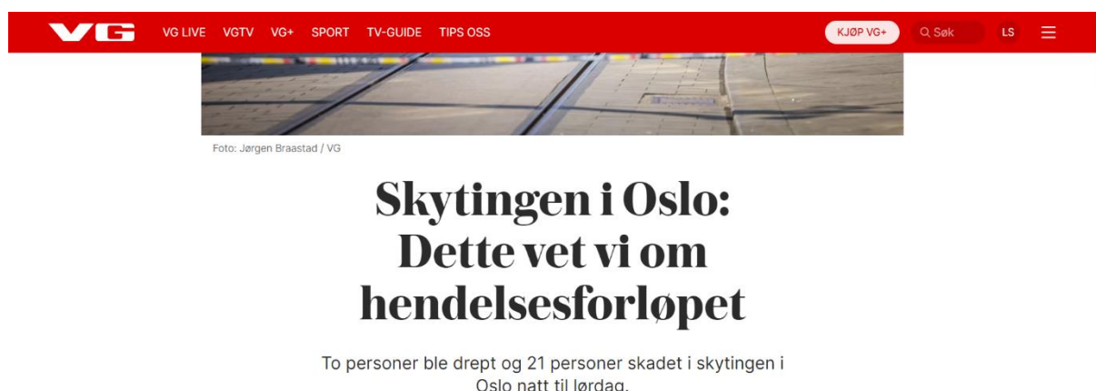
Figur 1 Skjermbilde av avisoverskrift fra 25. juni 2022 fra avisen VG (Breivik et al., 2022)

25. Juni 2022 følte jeg på noe jeg ikke hadde følt på en god stund. Jeg våknet opp til meldinger fra venner som sa de var trygge. Jeg forstod ikke helt hvorfor det var så mange av vennene mine som skrev dette, også venner av meg på tvers av vennegrupper. Jeg begynte å få meldinger av folk jeg ikke hadde hatt kontakt med på en stund, alle spurte om jeg var trygg. Noe hadde skjedd.