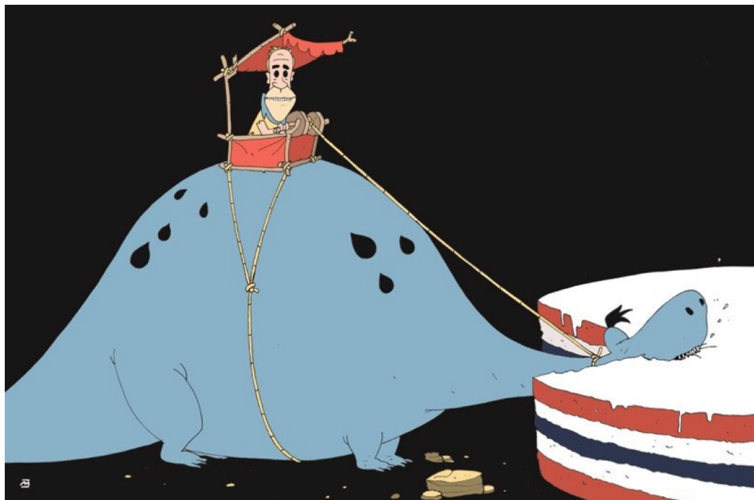
Figur 1. Marvin Hallerakner, Aftenposten

Dagbladets kommentator retter bekymringen for dårlig lønnsomhet eksplisitt mot oljepolitikkenes opprinnelige mål om å være lønnsom for staten, og sier at oljebransjen er i ferd med å gå fra å være melkeku til hellig ku, og at «det er et brudd med linja som har preget norsk oljehistorie. [...] samfunnet vil kaste penger etter oljebransjen». I likhet med i Aftenposten illustrerer avistegningen som pryder kommentaren et dystert fremtidsscenario der oljeinntektene ikke tilfaller staten. I Dagbladet ser vi en bredskuldret oljearbeider som pumper olje ned i gapet på «løven», men der pengene renner ut igjen gjennom baken til løven og ned i en flosshatt. Her vendes oppmerksomheten dermed mot en konsekvens av politikernes «svik» som ytterligere forverrer utsiktene, nemlig at det likevel kan bli profitt, men at denne ender opp på private hender. VG berører også dette temaet når hen svarer bransjen, som sier at de «uansett ikke setter i gang ulønnsomme prosjekter», med at «prosjekter kan være lønnsomme for selskapene, men ulønnsomme for Norge».