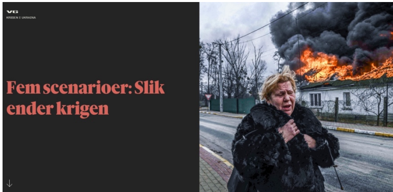
Figur 3: Første skjermbilde i VGs scenariofortelling om Ukraina, 5. mars 2022.

Vi skal se nærmere på artikkelen Fem scenarioer: Slik ender krigen , som ble publisert i VG på nett og papir 5. mars 2022 (Ridar, 2022, fig. 3). Dette er en omfattende tekst som går over fire sider i papirutgaven, og som krever mye skrolling på nett. Her skal vi konsentrere oss om netttutgaven. Den er utstyrt med store mellomtitler som signaliserer ett og ett scenario: 1 Et land i ruiner; 2 En av dem gir opp; 3 Forhandler seg til fred; 4 Palasskupp i Moskva; 5 Kina som mulig jokers . Saken er for abonnenter og derfor fri for reklameavbrudd. Leseren får opplevelsen av å skrolle seg gjennom fem koherente kapitler, rikt illustrert gjennom en miks av rektangulære bilder fra krigsskueplassen og sirkulære portretter av ekspertkildene. Redaksjonen har altså trukket presentasjonen noe i retning av featureformatet, men innholdet tilhører definitivt de harde nyhetene.