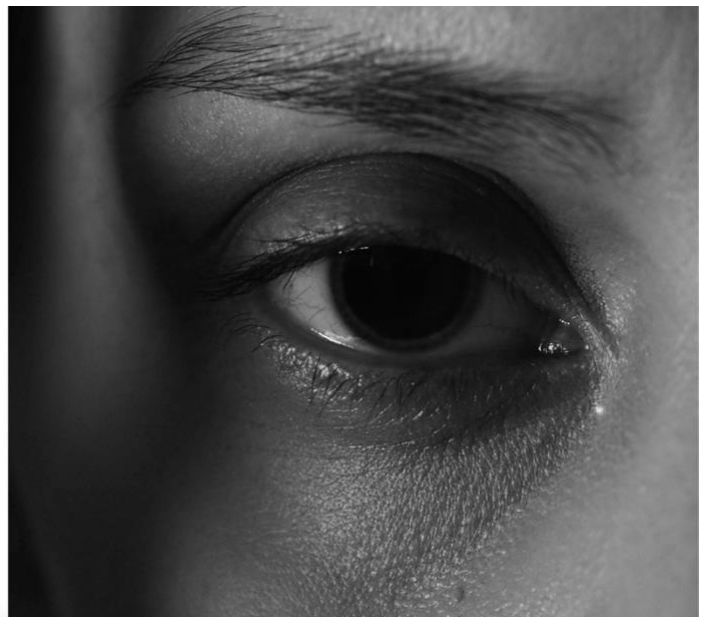
Skjerm bilde 4.2.1.1 (Foreningen Tryggere Ruspolitikk, 2020)

Verbalteksten forteller: “Emilie (17) døde av ecstasy på festival. Hun svelget alle pillene sine i panikk da hun så politiet.” (Foreningen Tryggere Ruspolitikk, 2020). Det visuelle får mye fokus i Straff skader . Jeg vil derfor starte med den visuelle retoriske analyse av kampanjehistorien til «Emilie».