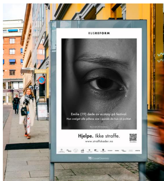
Skjerm bilde 4.1.2 (Foreningen Tryggere Ruspolitikk, 2020)