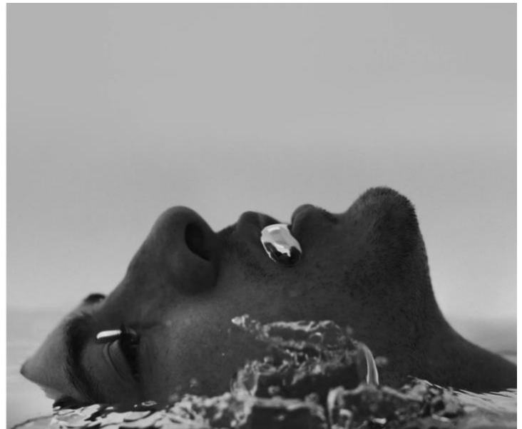
Skjerm bilde 4.2.2.1 (Foreningen Tryggere Ruspolitikk, 2020)