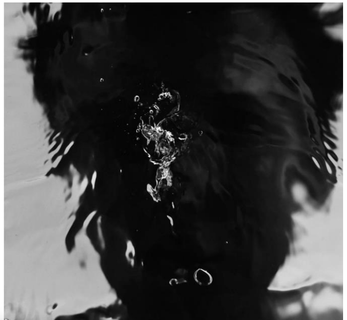
Skjerm bilde 4.2.3.1 (Foreningen Tryggere Ruspolitikk, 2020)

Verbalteksten forteller: «Ingen ringte 113 da Emil (21) tok en overdose. Vennene var rusa og fryktet politiet ville komme.» (Foreningen Tryggere Ruspolitikk, 2020). Kampanjehistorien til «Emil (21)» står visuelt i stil med de andre kampanjehistoriene i Straff skader . Jeg starter med den visuelle retorisk analysen av kampanjehistorien til «Emil (21)».