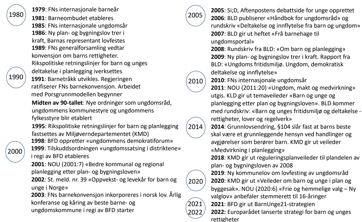
Figur 1: Historiske milepæler for ung medvirkning i Norge (bearbeidet etter Jørgensen 2013: 20-21).

Flere norske stortingsmeldinger har vært sentrale for utviklingen av rettighetsbasert medvirkning for barn og unge (se figur 1 under for historisk oversikt). Barn og unges behov og muligheter ble satt på kartet i Norge gjennom St.meld. nr. 76 (1971-72) som handlet om boligspørsmål og sikring av de unges fysiske miljø rundt boligen (Bringeland 2017). Noen år senere kom St.meld. nr. 17 (1977-1978) som omhandlet barns oppvekstvilkår og viktigheten av å opprettholde variert og allsidig lek ved utbygginger.