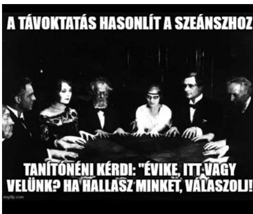
E) Från BNN: A távoktatás hasonlít a szeánszhoz

ord i flera olika memes. För majoriteten av studenter, akademiker och kontorsanställda i Facebookgrupperna vi har följt har pandemin präglats av hemmakontor och digitala möten. Även om de flesta vid den tidpunkt då denna meme spreds nu behärskade tekniken och hade lärt sig att hantera kamera, mikrofon, delningsfunktioner och ljud-dämpningsfunktioner, har videokonferenser sina egna problem, såsom krångliga wifi-kontakter och dåliga headset. Skämt om