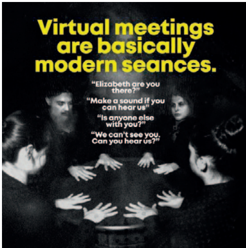
D) Från KM: Virtual meetings are basically modern seances

ord i flera olika memes. För majoriteten av studenter, akademiker och kontorsanställda i Facebookgrupperna vi har följt har pandemin präglats av hemmakontor och digitala möten. Även om de flesta vid den tidpunkt då denna meme spreds nu behärskade tekniken och hade lärt sig att hantera kamera, mikrofon, delningsfunktioner och ljud-dämpningsfunktioner, har videokonferenser sina egna problem, såsom krångliga wifi-kontakter och dåliga headset. Skämt om