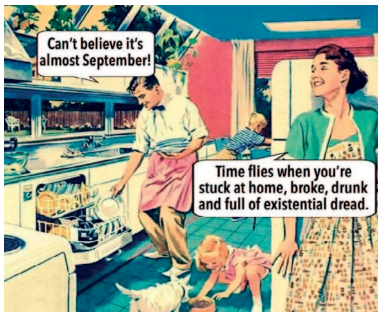
C) Från KM: Can't believe it's almost September!

själv underhållen under den stillastående vardagen hemma.