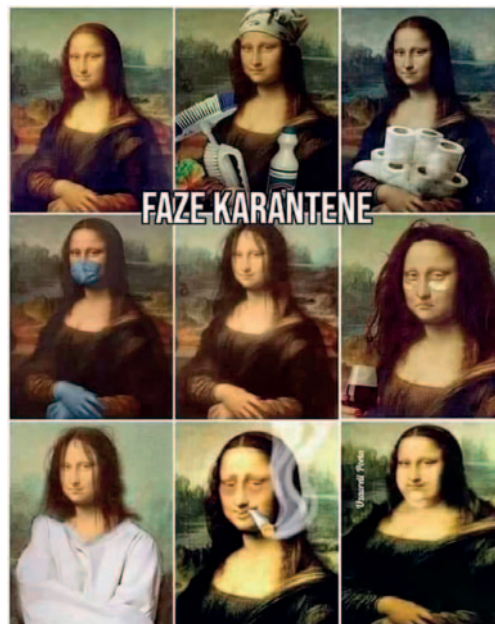
F) Från BNN: Faze karantene

Meme F delades på BNN i november 2020 av en kroatisk etnolog. Det är en kreativ version av de otaliga memerna som delades under pandemin med olika variationer på temat "du bryter ner långsamt efter att ha varit hemma för länge". I det här fallet kände personen som postade inte något behov av att översätta texten i memena.