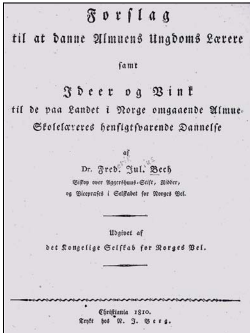
Biskop Bechs ambisiøse plan for lærerutdanningen. Skannet fra original i Gunnerusbiblioteket, Trondheim.

skulle gjennomføres i løpet av 3 år, sa direksjonen 12. 53