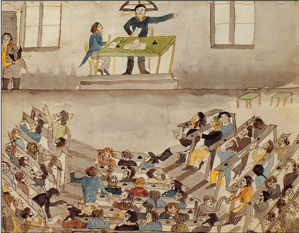
Stortingsforhandlinger i Katedralskolens hørsal, tegnet av Henrik Wergeland.