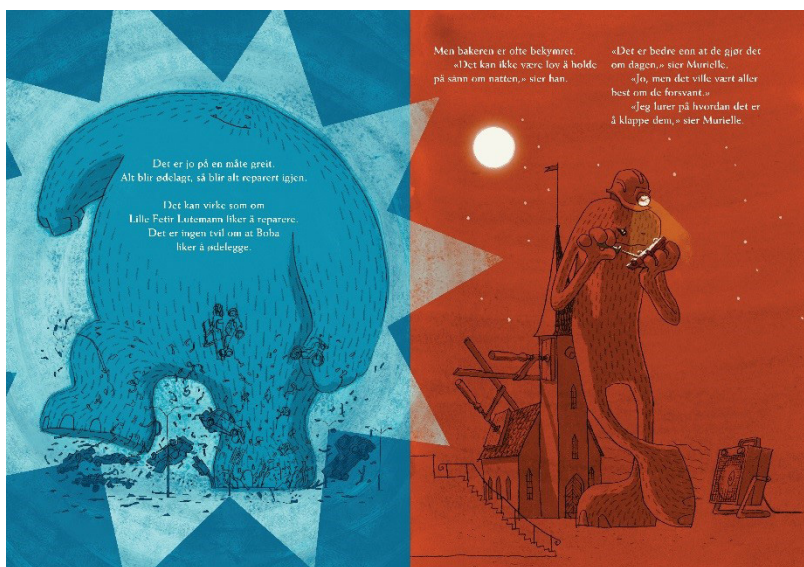
Bilde 1. Oppslag 8 fra Når alle sover (Houm og Markhus).