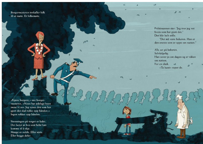
Bilde 3. Oppslag 11 fra Når alle sover (Houm og Markhus).