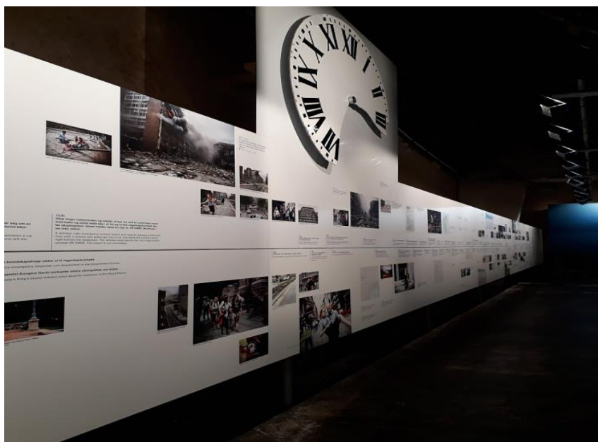
Figur 1: 22. juli-senterets tidslinje.

Disse er med på å illustrere noe av kaoset, fortvilelsen, sorgen, sjokket og dramatikken som mennesker opplevde 22. juli 2011. Her kan man også finne rester av bombebilen, samt mobiltelefoner, kameraer og musikkspillere som har tilhørt leirdeltakere som var på Utøya. Går man videre, kan man se filmatiserte vitnebeskrivelser fra overlevende, vitner og redningsmannskaper fra både regjeringskvartalet og Utøya. Utstillingens siste rom er viet dagene og tiden etter terroraksjonene, og viser blant annet bilder av mange av minnemarkeringene som fant sted i hele landet, sammen med et stort bilde av blomsterhavet utenfor Oslo Domkirke. I tillegg har rettssaken mot gjerningsmannen fått plass gjennom bilder og tekstutdrag fra dommen. I en monter finner man også bevismaterialet fra rettssaken, blant annet Breiviks falske politi ID-kort og de falske politiemblemene som var festet på uniformen han brukte under terroranslagene.