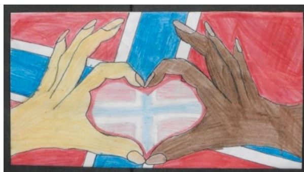
Figur 3: Tegning fra minnematerialet etter 22. juli 2011.

Den største kategorien er den som har fått navnet samhold . Den inkluderer bilder knyttet til sorg, rosetog, kjærlighet eller hashtagen #oslolove som er flittig brukt av mange. Fotografiene denne kategorien var relativt enkle å gjenkjenne. Symboler som roser og hjerter var ofte iøynefallende, og flere av utstillingene hadde også fått tittelen «Samhold», «Sammen er vi sterke» eller lignende. Et stort antall bilder i denne kategorien var hentet fra tiden etter 22. juli; rosetog, blomsterhav og sørgende politikere som klemte hverandre. Det er et ganske stort utvalg motiver i denne kategorien som er gjort tilgjengelig for elevene. Inkludert i materialet er også et utvalg bilder fra minnematerialet som ble samlet inn og arkivert i etterkant av terroren. Et bilde mange elever hadde inkludert i sin utstilling var dette: