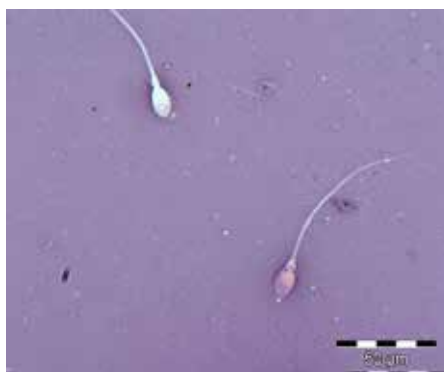
FIGUR 2: Spermievitalitet. Spermier farget med eosin-nigrosin fargeløsning. Rød spermie klassifiseres som død, hvit som levende.

Progressiv motilitet har tidligere vært inndelt i rask og langsom (5). De to kategoriene ble slått sammen i 2010-manualen fordi enkelte mente det var vanskelig å vurdere de raskt progressive nøyaktig og reproducerbart (6). Det er fremdeles uenighet i fagmiljøene om betydningen