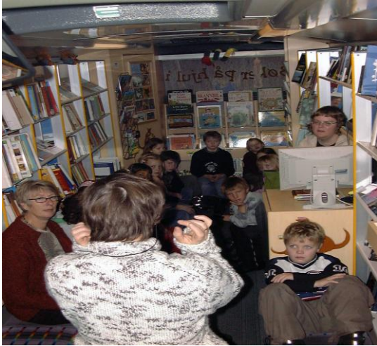
Bokprat på bokbussen i Buskerud