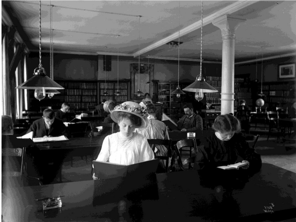
Lesesalen ved Deichmanske bibliotek, 1909.