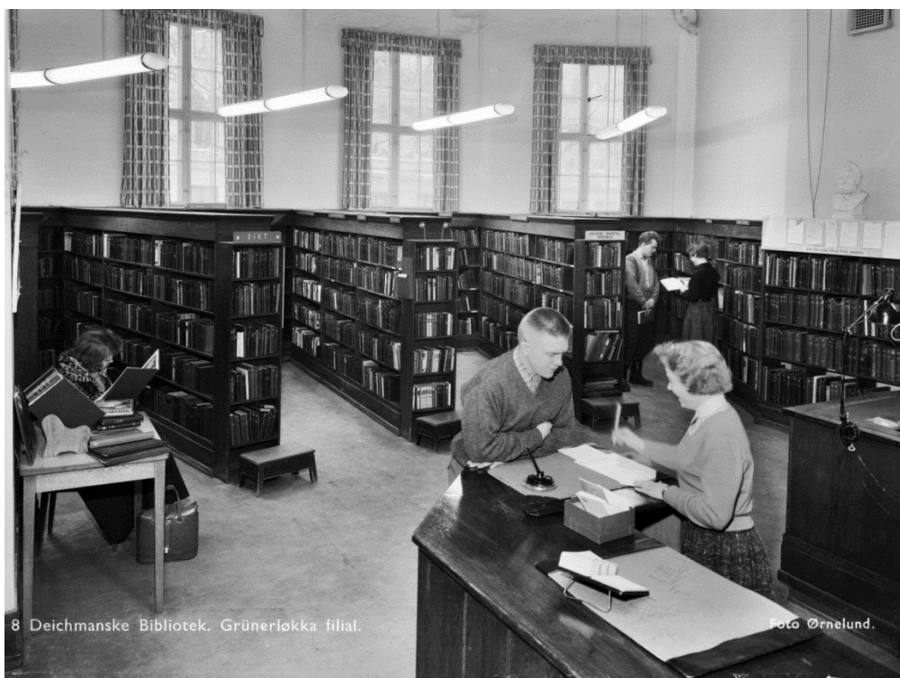
Deichmanske bibliotek, Grünerløkka filial, 1959.

Det ser også ut til at praksisfeltet har savnet denne typen kunnskap hos de nyutdannede bibliotekarene: I 1973 kom det et hjertesukk fra to bibliotekarer ved Tønsberg bibliotek i studentavisen: «Skolen bør gjennom undervisningen sette studentene i stand til å bli utadrettede ovenfor lånerne [...] Vi trenger menneskekunnskap, glød og interesse for yrket.» (Gossner & Gossner, 1973)