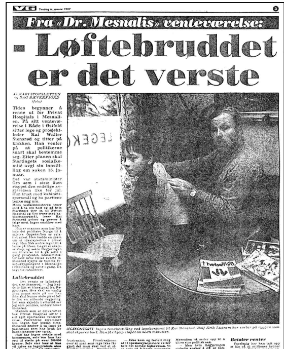
Figur 6. Helsestoff som privatiseringsdebatt: eksempel fra VG 6.1.1987