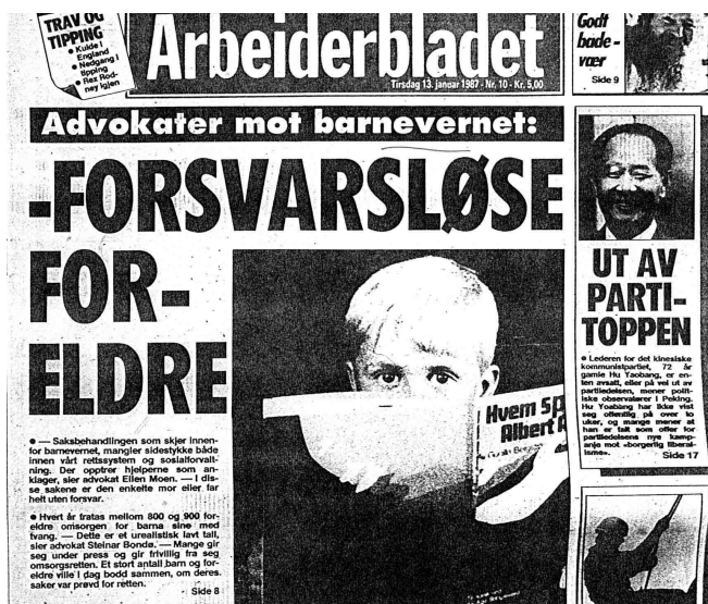
Figur 1. Barnevernsdekningen i 1987: eksempel fra Arbeiderbladet 13.1.1987

Omtalen av fattigdom og barnevern har også hver sin markerte topp. Disse er likevel ikke forårsaket av utspill «ovenfra», men av hendelser «nedenfra» eller forårsaket av mediene selv. Dekningen av barnevern i 1987 gjenspeiler en omfattende offentlig debatt om rettssikkerheten i barnevernet (se figur 1 for et eksempel). Leserne møtte fortvilte foreldre som ble fratatt omsorgen for sine barn. På den annen side slapp