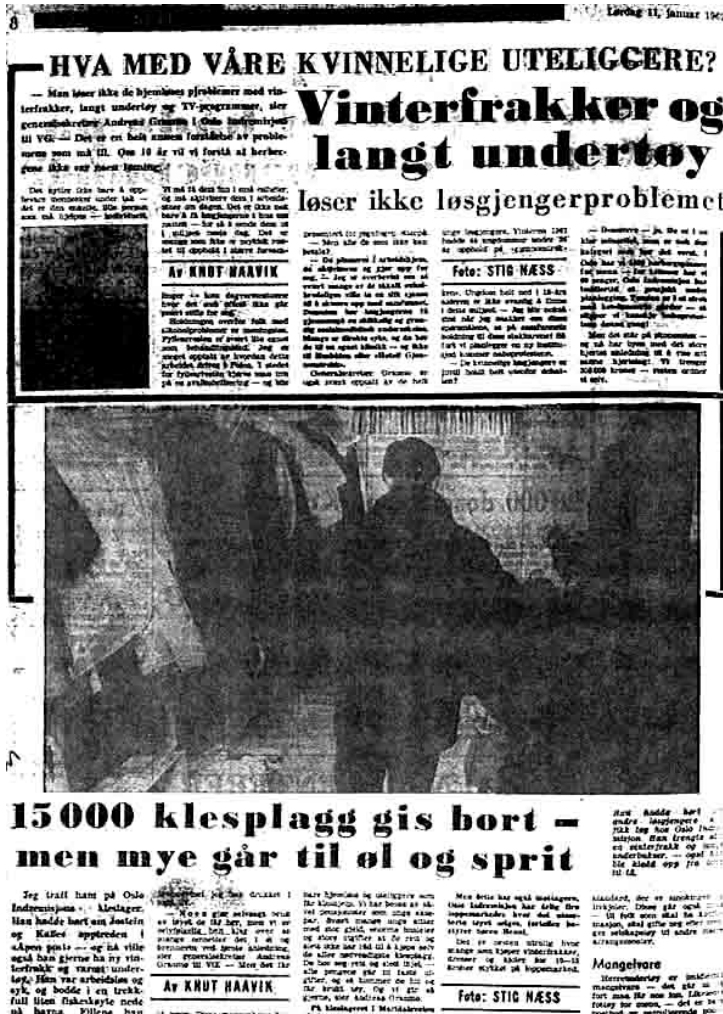
Figur 2. Fattigdomsdekningen i 1969: eksempel fra VG 11.1.1969

Det generelle inntrykk av mediers framstilling av denne type saker, er at barnevernet lider av en – i juridisk forstand – sykkelig trang til barnerøvereri. ... Barnevernsarbeideren [må] tåle en mediaomtale som inneholder anklager om sendrektighet, formell inkompetanse, faglig uduelighet og i visse tilfeller direkte barnefiendtlighet. ... Resultatet blir angst for å gjøre noe overhodet. 8