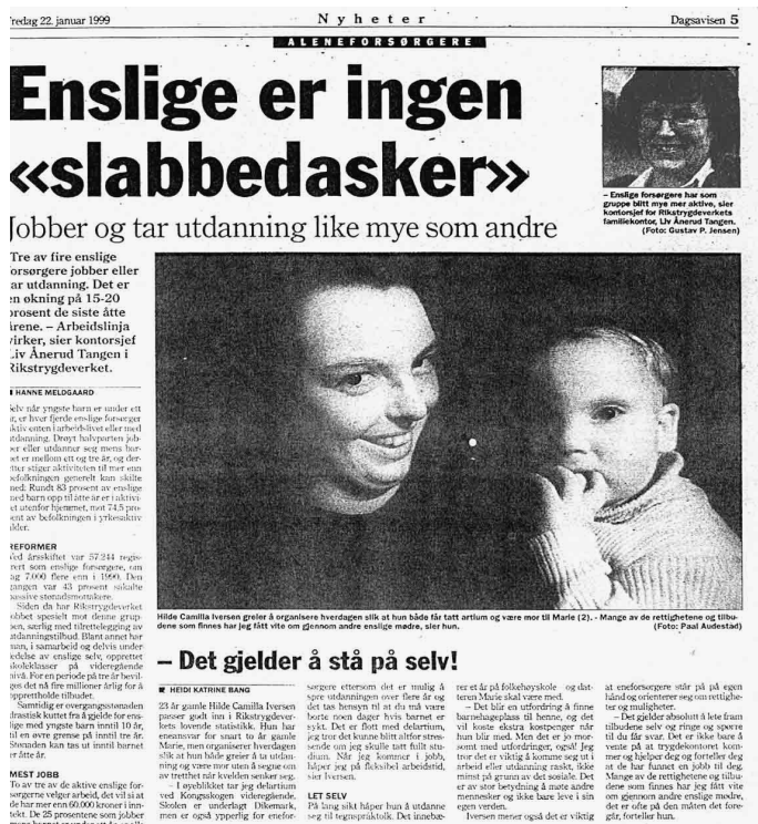
Figur 11. Personifisering av statistikk: eksempel fra Dagsavisen 22.1.1999

erfaringer, for å gjøre stoffet levende for leseren. Når offentlig statistikk viser at «enslige forsørgere er slett ikke late», finner avisen fram til en aktiv og innsatsvillig enslig mor (se figur 11). 29 Skal vi selv illustrere denne tendensen, er det fristende å bruke et tilfelle der en av oss selv opptrer i materialet. Her slo forskeren ikke alarm, men fortalte tvert imot at viljen til å betale for de eldres velferdsgoder var svært høy blant de unge. Forskerens resultater ble supplert med to eldre menneskers synspunkter, nærmest som en kontroll på at forskerens tall stemte med folks hverdags erfaringer. Og forskeren fikk støtte: «Unge mennesker i dag både tenker og gjør mye positivt, mens jeg aldri tenkte på eldre da jeg var ung», fortalte en eldre kvinne. 30