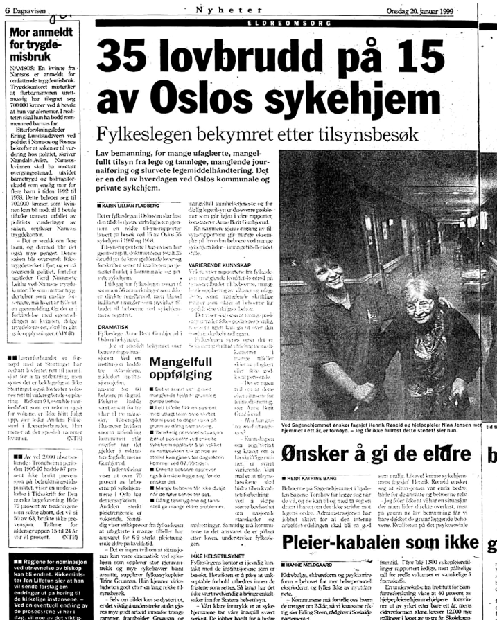
Figur 9. «Eksperten slår alarm»: eksempel fra Dagsavisen 20.1.1999