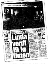
Dagbladets omtale av saken i går.