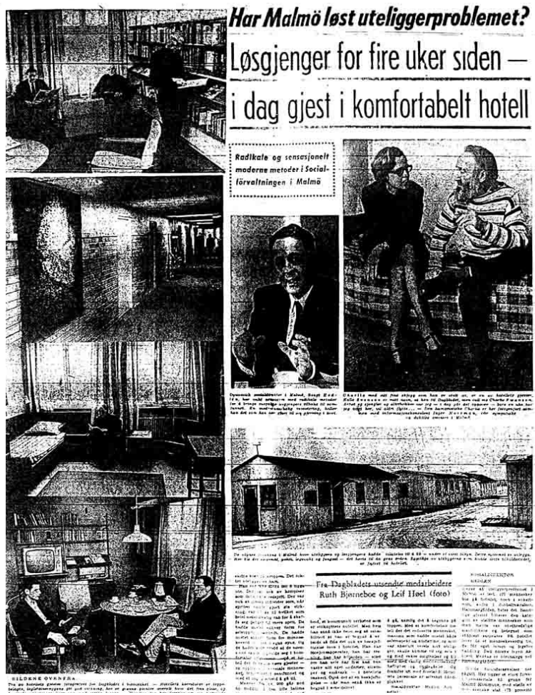
Figur 8. Pressens omsorg for de svake: eksempel fra Dagbladet 18.1.1969

Figur 7 tydeliggjør også at norsk tabloidpresse slett ikke rommer mange innslag om medborgernes misbruk av offentlige tjenester. Misbruksvinklingen er faktisk enda mer minimal i løssalgspresen enn i abonnementsavisene. Når artiklene handler om noen form for «misbruk», er det som oftest spørsmål om barnevernet misbruker sin makt – noe som er klassifisert under administrasjonsvinklingen. Løssalgspresens opp-tatthet av enkelt-skjebner ser ut til å være sterkere enn ønsket om å avsløre juks og misbruk. Høydepunktet for tabloid omsorg for de svake fant vi i 1969, i Dagbladets beretning om moderne sosialforvaltning i Malmö (se figur 8). Nærmere