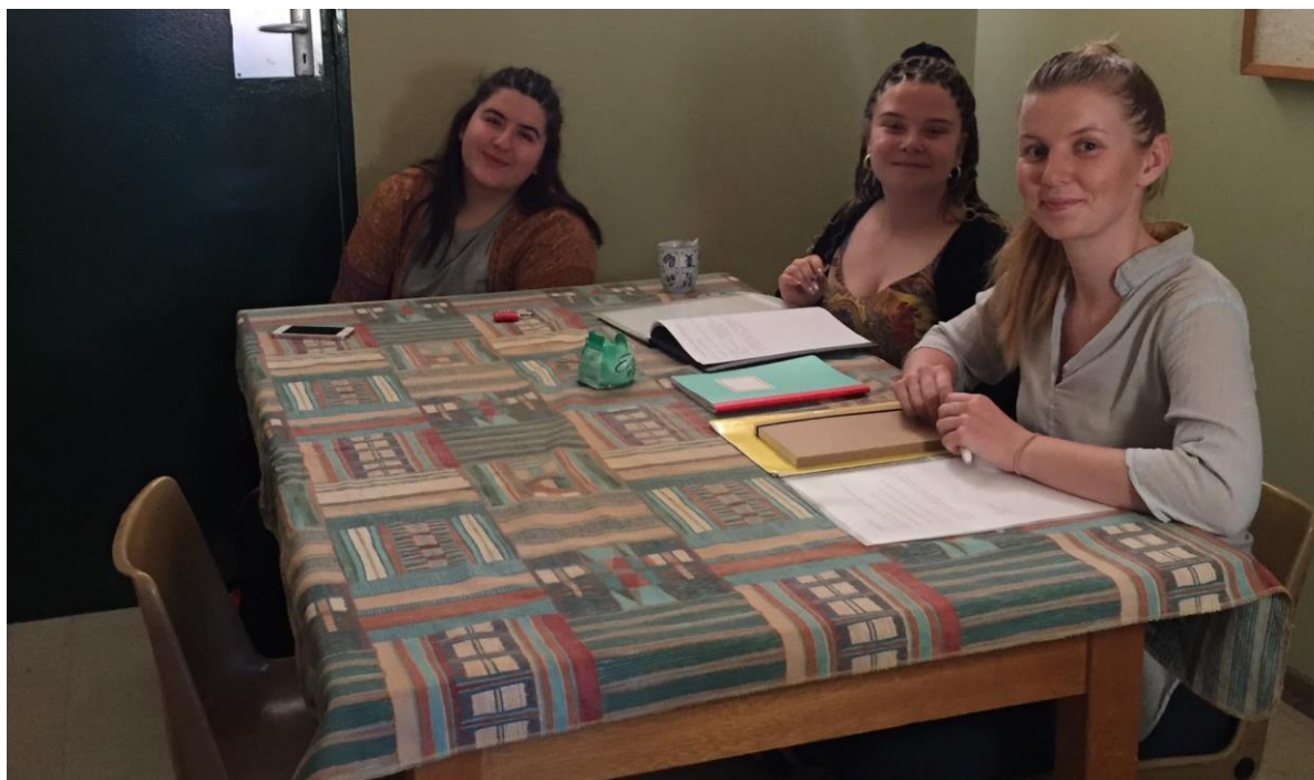
En intervjusituasjon ved Paresis Secondary School (2017).