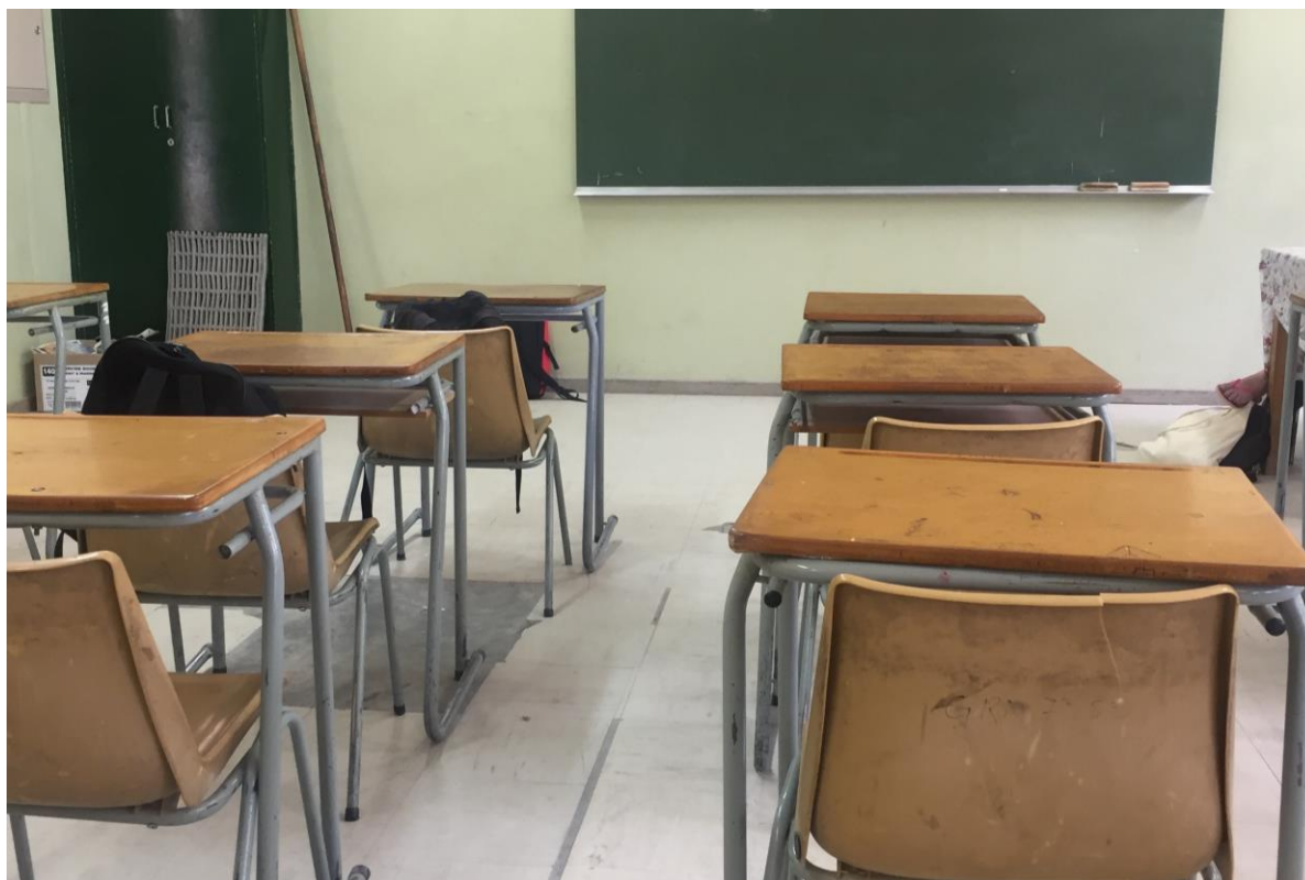
Et klasserom ved Paresis Secondary School (2017). Privat fotografi