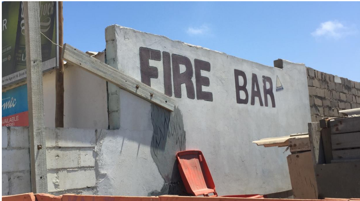
En bar i 'location' (2017). Privat fotografi