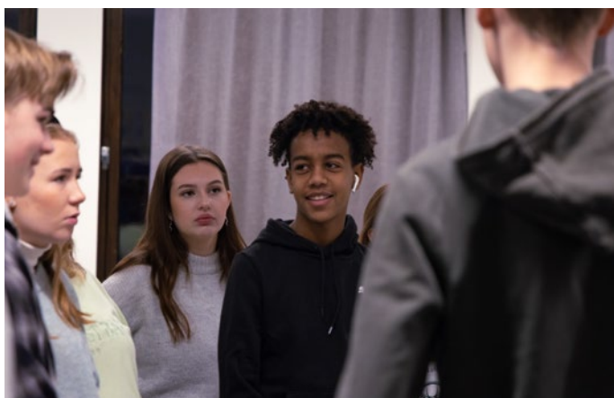
Ungdomsskoleelever deltar på Det europeiske Wergelandsenterets læringstilbud «22. juli og demokratisk medborgerskap» på Utøya.

Dette er hovedbudskapet fra forskningsprosjektet DEMOCIT ved OsloMet – storbyuniversitetet, som har foregått 2020–2023. Med utgangspunkt i norske resultater fra The International Civic and Citizenship Education Study (2016) har prosjektet samlet nye data om demokratiundervisningen i et utvalg norske ungdomsskoler hvor elever skårer signifikant høyere på politisk mestringstro enn det bakgrunnsvariablene skulle tilsi. Hva er det disse skolene gjør som får elevene til å tro på egne evner til å delta i demokratiet? For ytterligere å belyse temaet har prosjektet også undersøkt hvordan ungdom oppfatter demokrati og politikk, både som elever og i jevnaldermiljøet utenfor skolen.