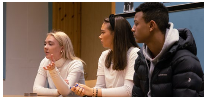
Ungdomsskoleelever deltar på Det europeiske Wergelandsenterets læringstilbud «22. juli og demokratisk medborgerskap» på Utøya.