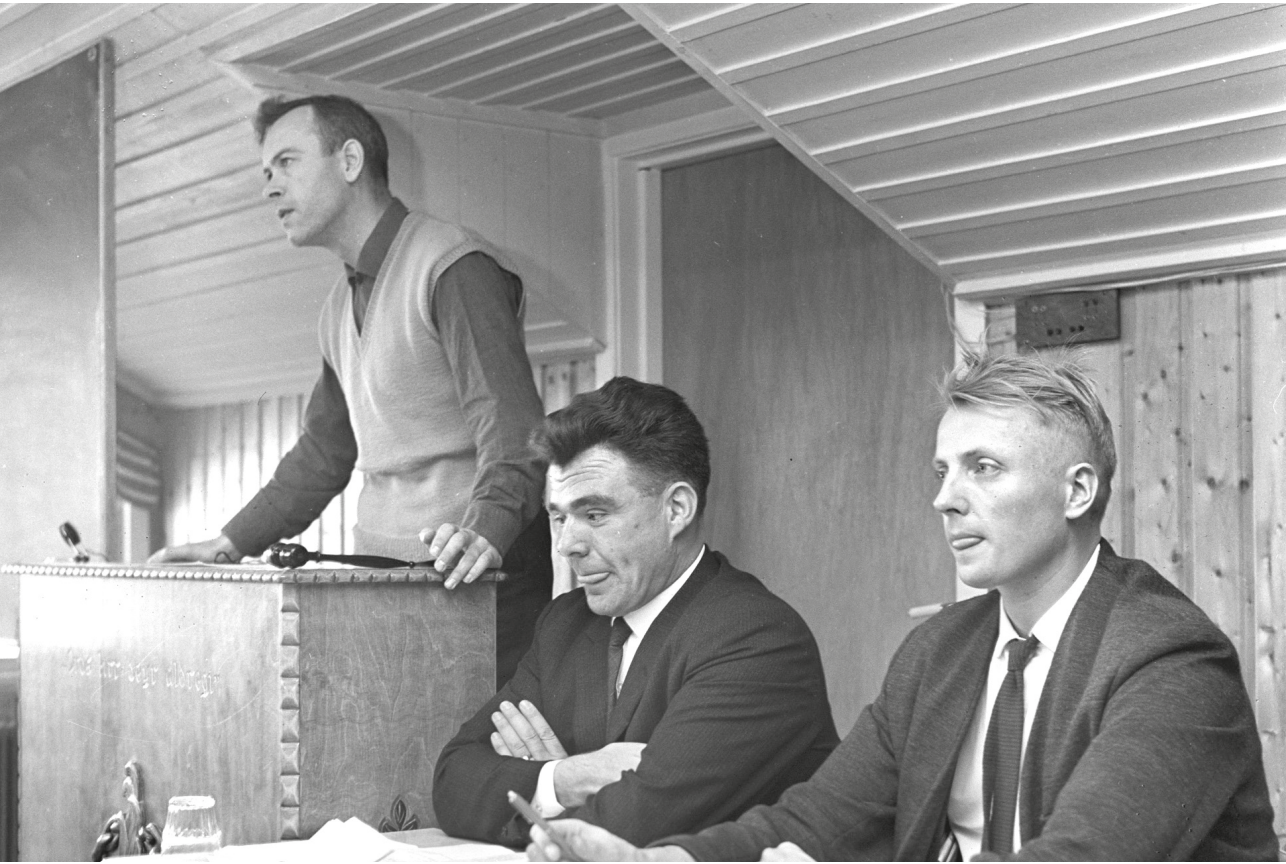
Gunnar Garbo (til venstre) på talerstolen under Venstres landsmøte på Gjøvik i 1964.