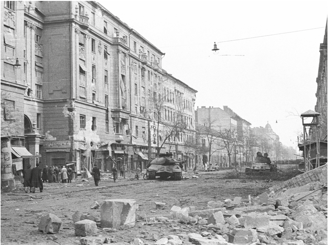
Ødelagte gater og bygninger i Budapests 8. distrikt, etter at sovjetstyrker hadde slått ned opprøret høsten 1956.

og layout. En ny logo med skinnende røde farger dukket opp 1. juli. Samtidig blir lederen markert tidligere med egen logo og redaktørens navn med mye større bokstaver enn tidligere. Vi aner en selvbevisst redaktør som ville ha en tydeligere profil.