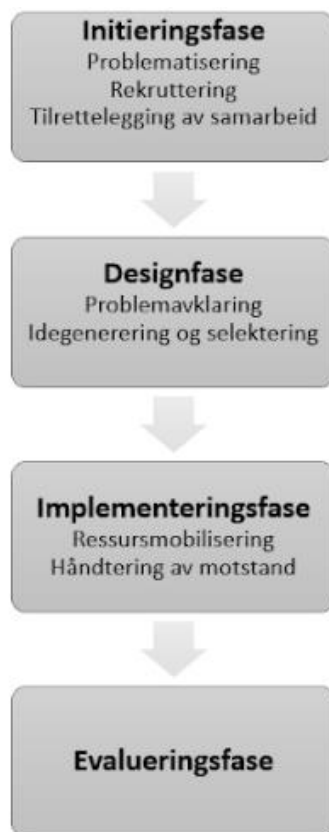
Figur 2. Basert på samskappingsmodellene til Ansell og Torfing (2021, s. 134) og Van der Graaf et al. (2022, s. 46)

2021, s. 135). Modellen vår består av til sammen fire faser: initiering, design, implementering og evaluering.