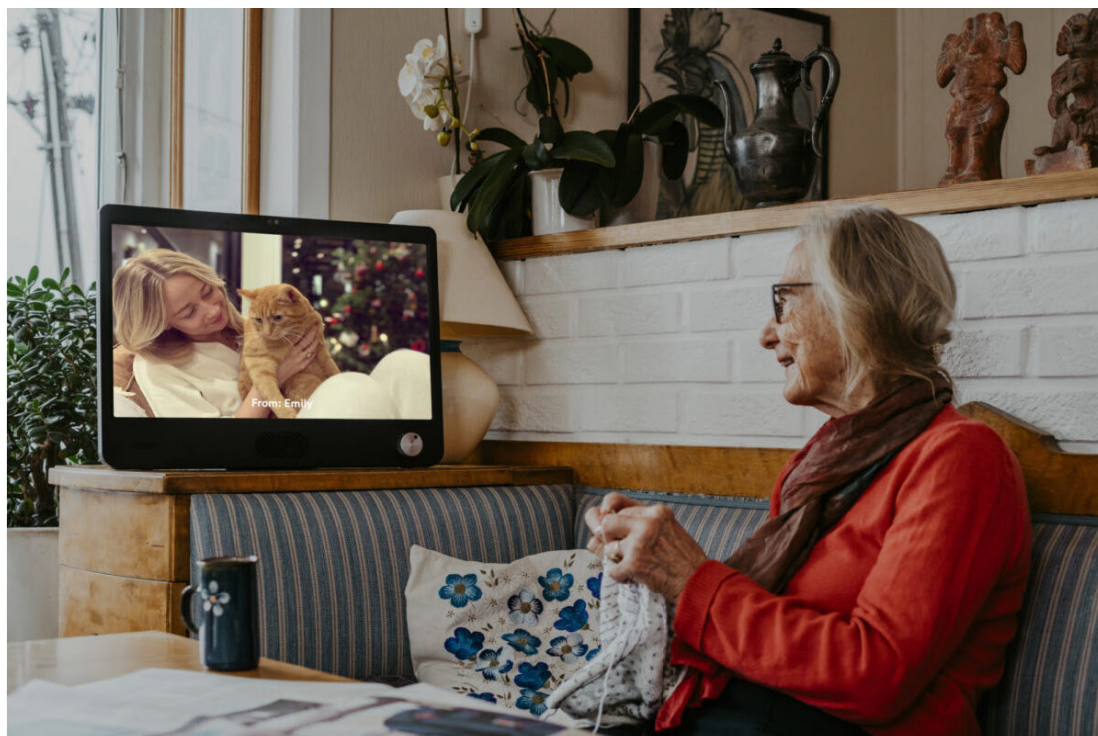
Bilde 1. Promobilde fra produsenten, brukt med tillatelse.