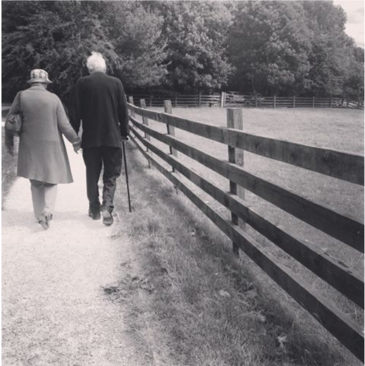
Bilde 3. Et eldre par nyter sitt otium i eget tempo