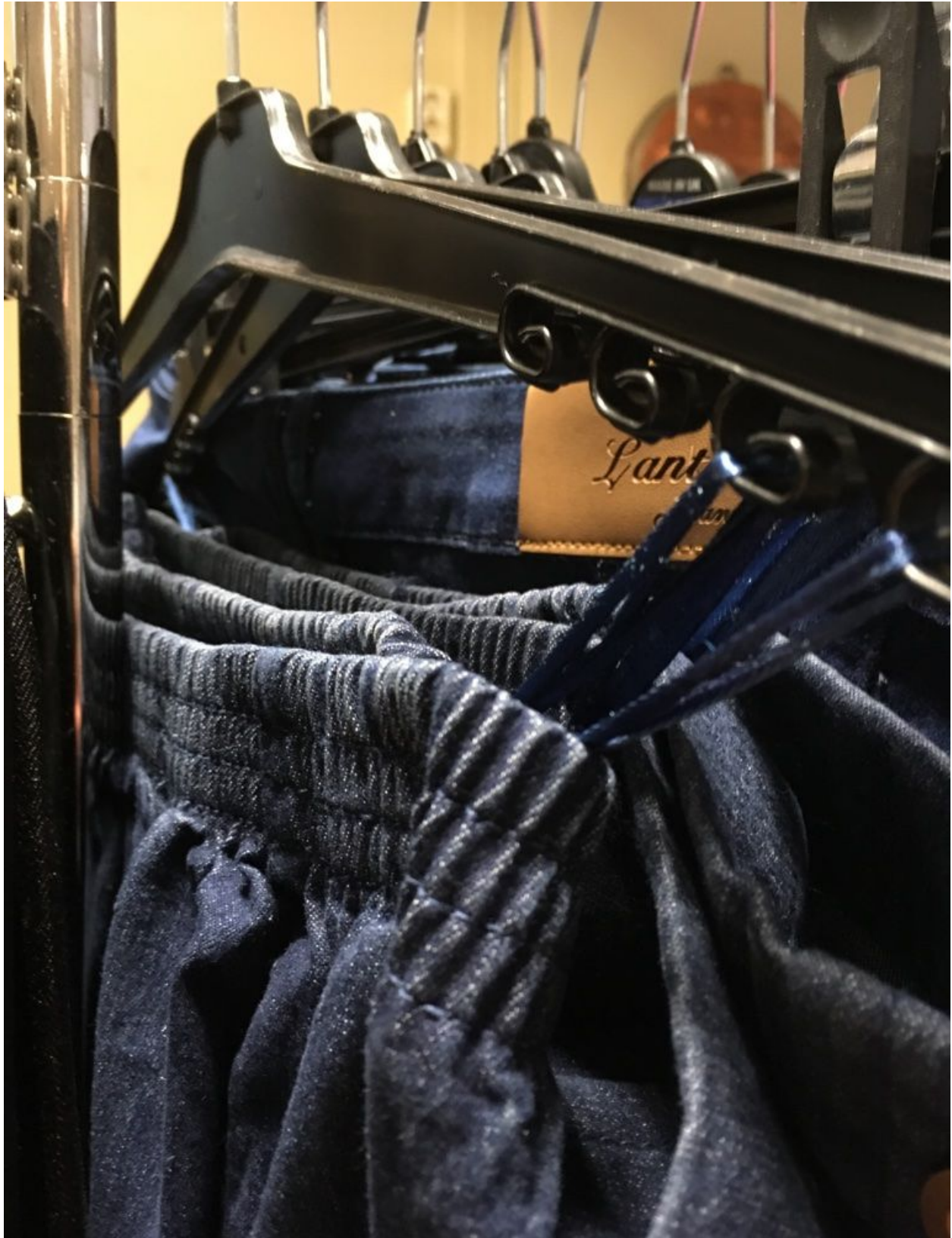
Bilde 2. Klær som selges på omsorgshjem og dagsenter for eldre (foto: privat, mars 2018).