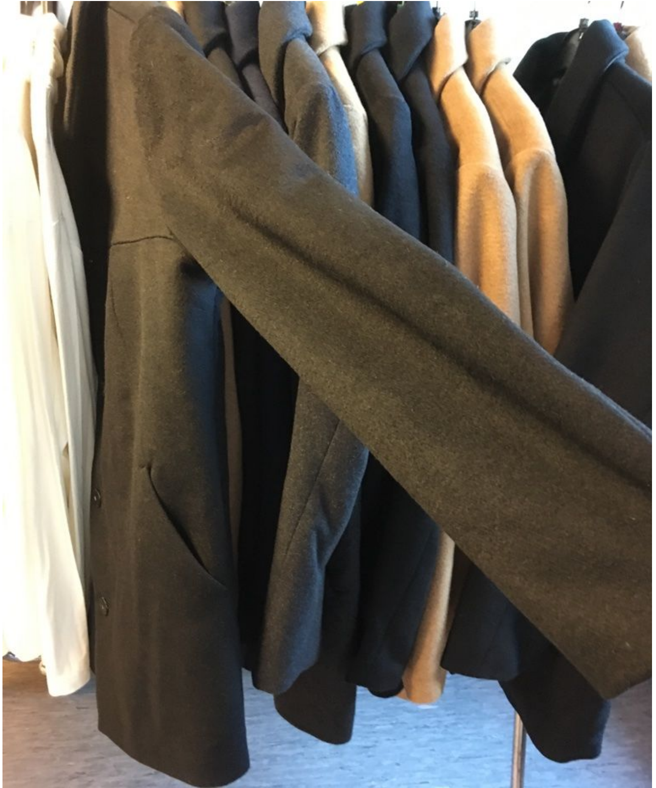
Bilde 9. Klær som selges på omsorgshjem og dagsenter for eldre (foto: privat, mars 2018).