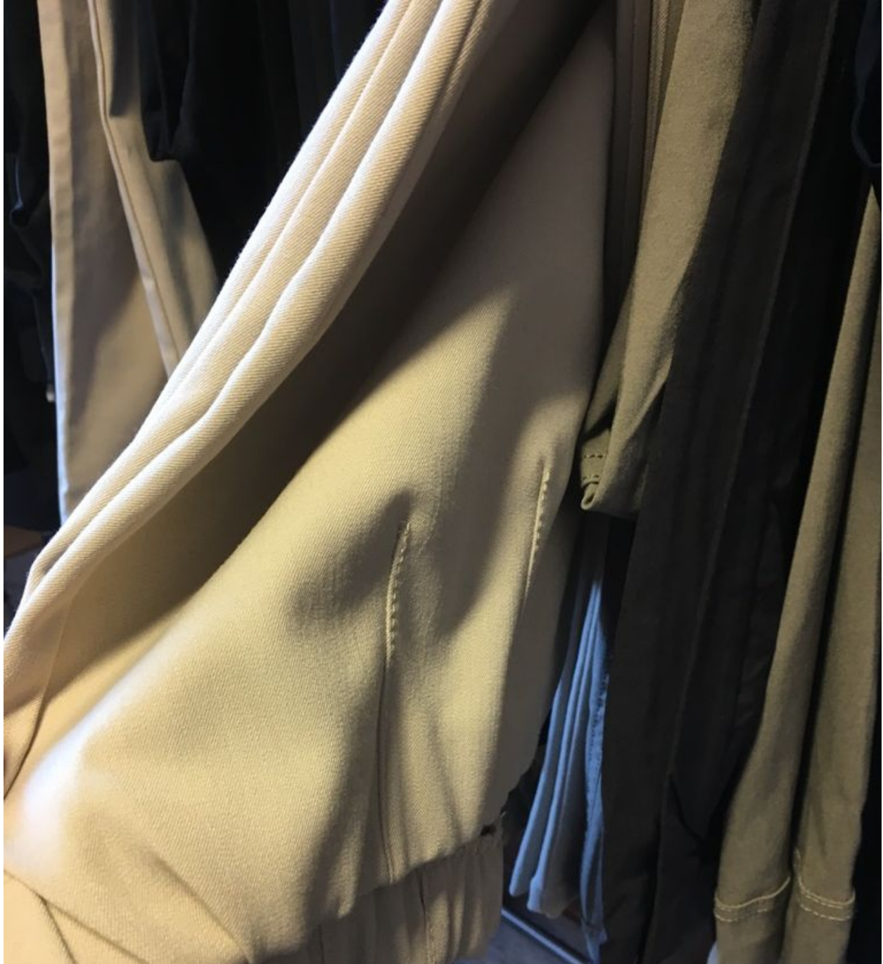
Bilde 4. Klær som selges på omsorgshjem og dagsenter for eldre. Bukser med elastisk liv i syntetisk tekstil (foto: privat, mars 2018).