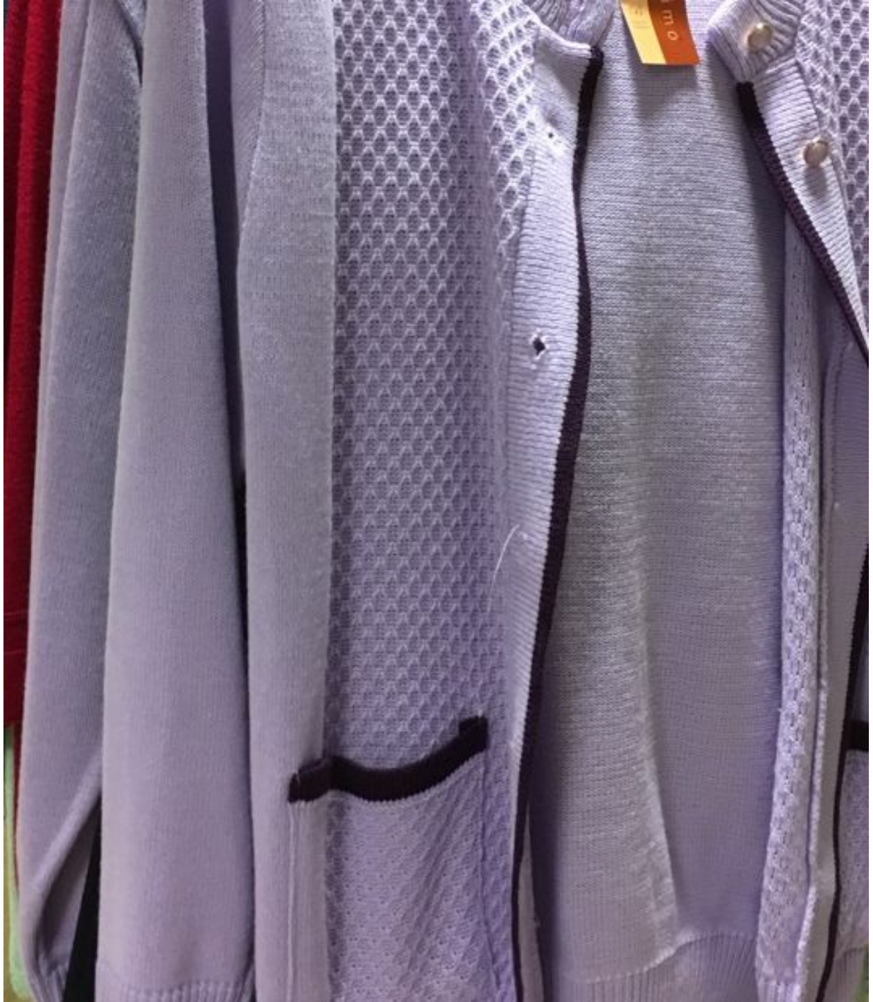
Bilde 2. Klær som selges på omsorgshjem og dagsenter for eldre (foto: privat, mars 2018).