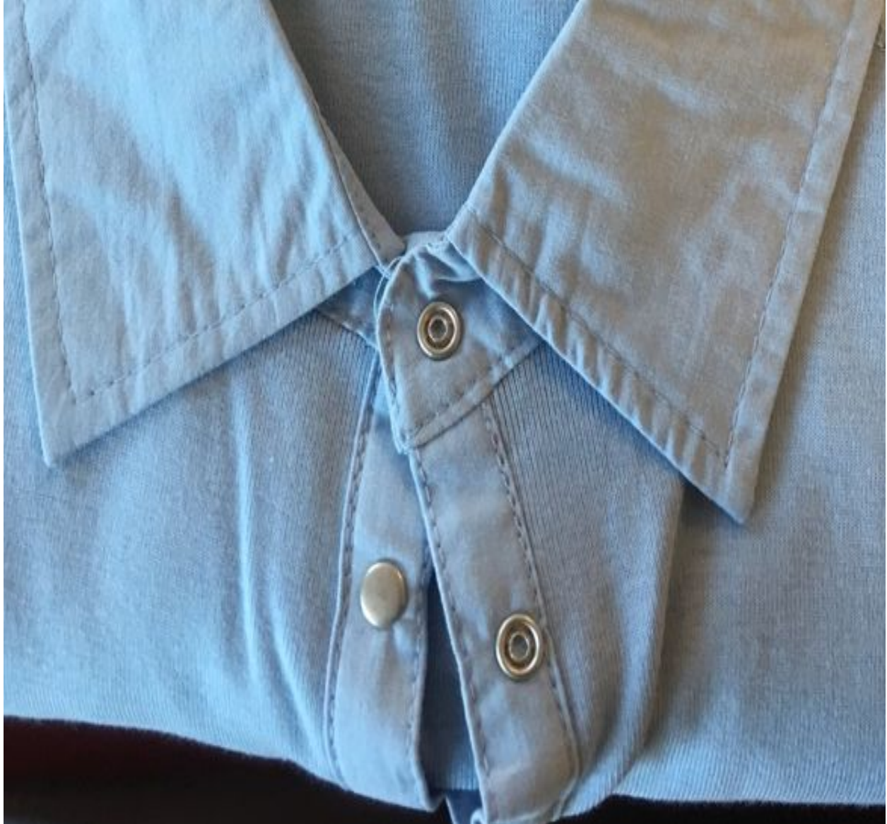
Bilde 1. Klær som selges på omsorgshjem og dagsenter for eldre. Denne skjorten i bomull er en klassiker (mars 2018).