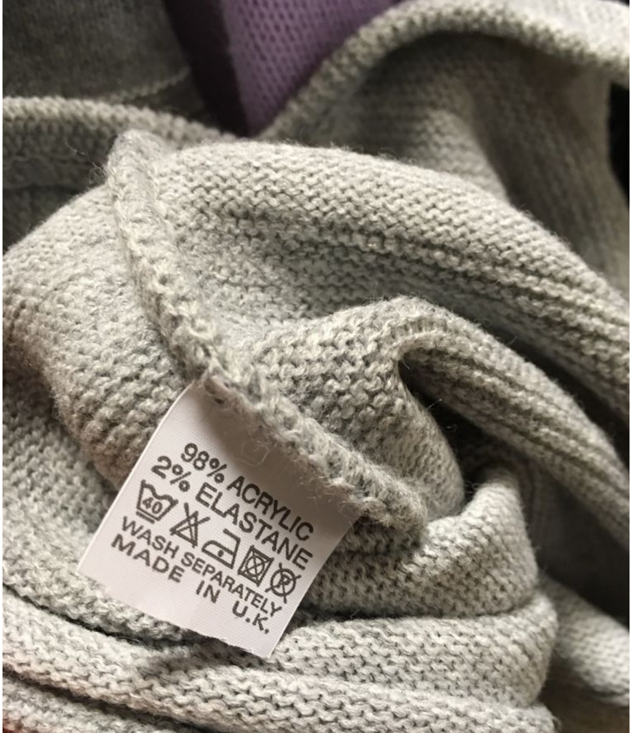
Bilde 10. Klær som selges på omsorgshjem og dagsenter for eldre (mars 2018).