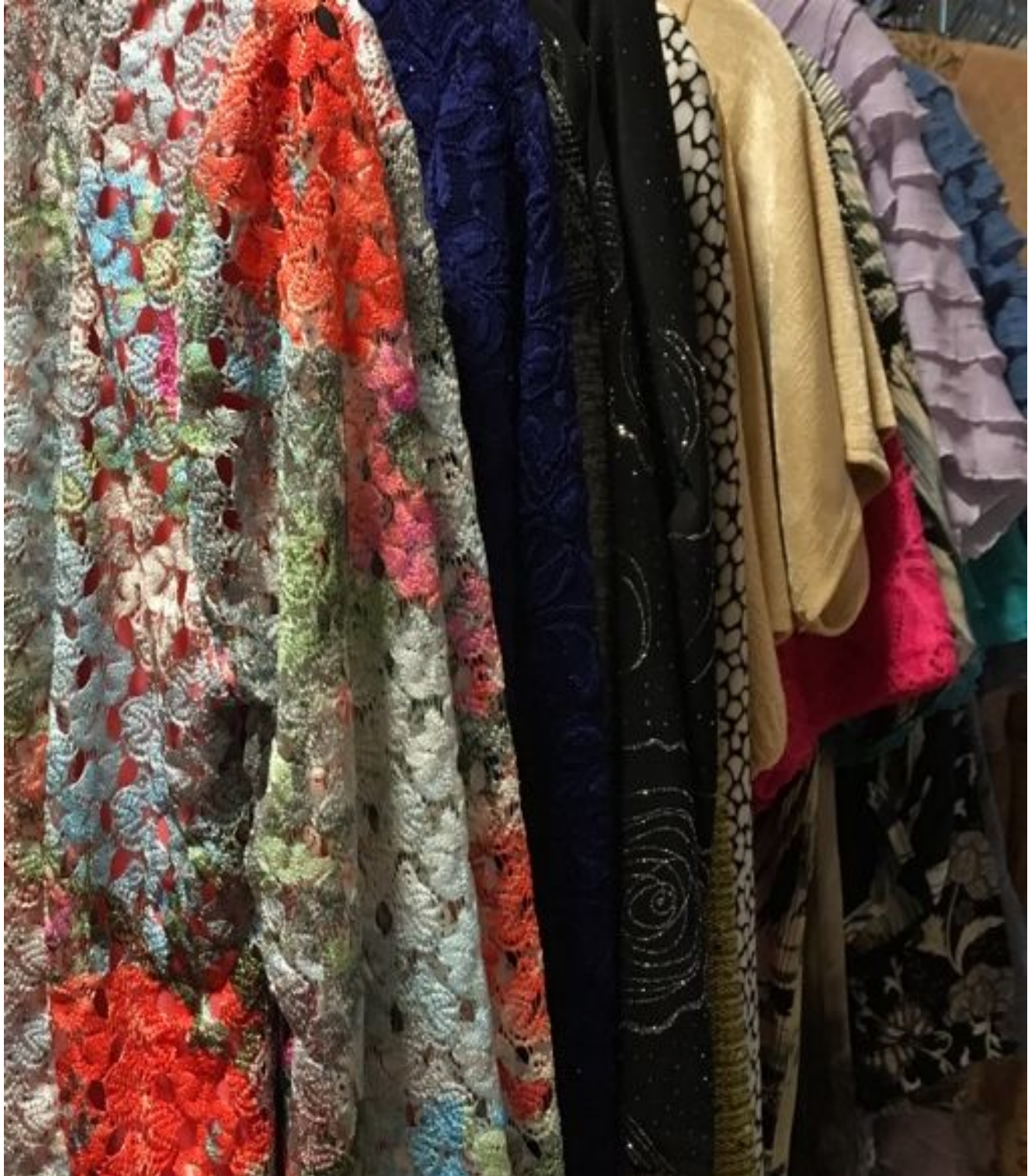
Bilde 8. Klær som selges på omsorgshjem og dagsenter for eldre (mars 2018).