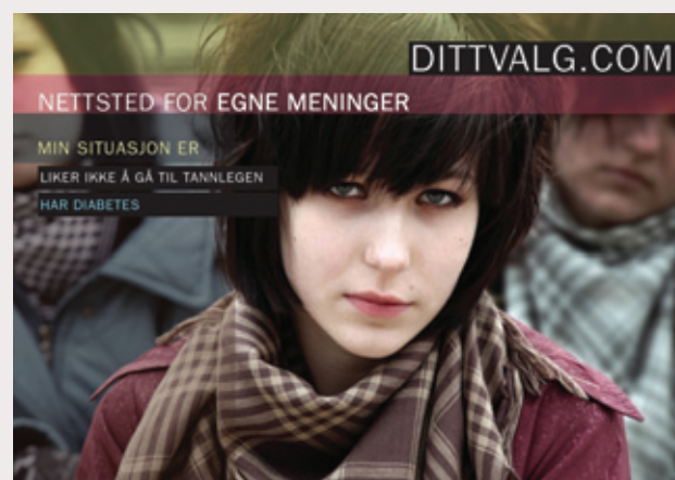
Figur 2. Design på ny nettside ( www.dittvalg.com ).

Våre ideer er i tråd med ny litteratur som konkluderer med at vår kliniske kommunikasjon i større grad må fokusere på pasientens egne meninger, ønsker og motivasjon, og at interaktive nettbaserte programmer kan bli nyttige verktøy på tannklinikken (31).