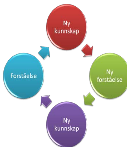
Figur nr.1 Gadamer's hermeneutiske sirkel

Dialogen er som selve grunnformen i den menneskelige eksistensen i utvidet betydning. Når oppgaven er å forstå, tolke, finne ut av mening og hensikt kan det være naturlig å bruke ”Den hermeneutiske sirkel bygge ny forståelse på førforståelse” Den prosessen som veksler mellom å se helheter og studere enkelte deler og igjen å forstå en ny helhet kan la seg gjennomføre etter modell av den hermeneutiske sirkel.