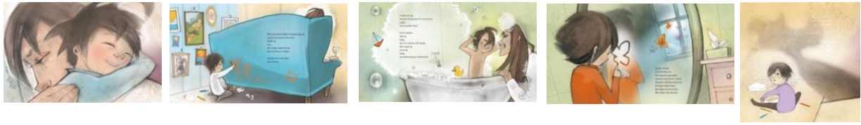
Bilde 1 «Klem»