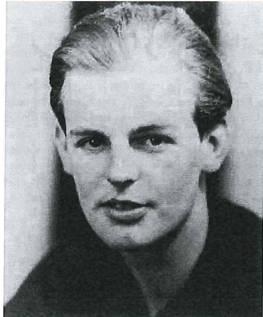
I mai 1951 hoppet de britiske diplomatene Guy Burgess og Donald Maclean av til Sovjet. Begge hadde vært knyttet til den britiske ambassaden i Washington – og begge var tiltrukket av menn. Sammenhengen mellom kommunisme og homoseksualitet var dermed demonstrert.