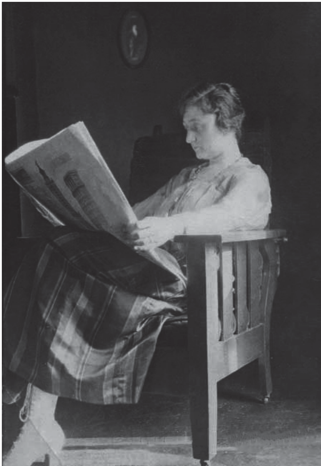
Leseferdighetene blant nordmenn økte bratt det siste halve århundret før den russiske revolusjon, og de seriøse ukebladene var opptatt av å kombinere underholdningsstoff med å gi leserne litt mer å bite i. (Foto: En kvinne leser avis, 1917. Fotograf ukjent)