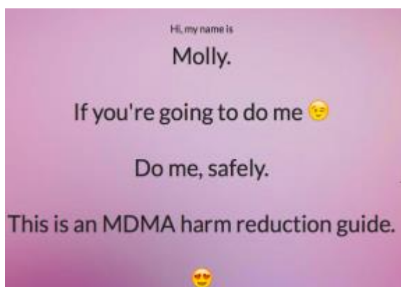
Figur 3 Nettsted for skaderedusering ved bruk av MDMA

I tråden som omhandler tips til å bruke rus på en sunn måte og dermed ikke ende opp med misbruk, vises det til to internettsider som begge er laget som rusguider for å minske risiko ved bruk av MDMA/ecstasy og LSD. Bildene nedenfor er hentet fra de to nettsidene og er det første man ser når man kommer inn på disse nettsidene. "Molly" og "Lucy" blir brukt som slang/kallenavn på henholdsvis MDMA og psykedeliske rusmidler.