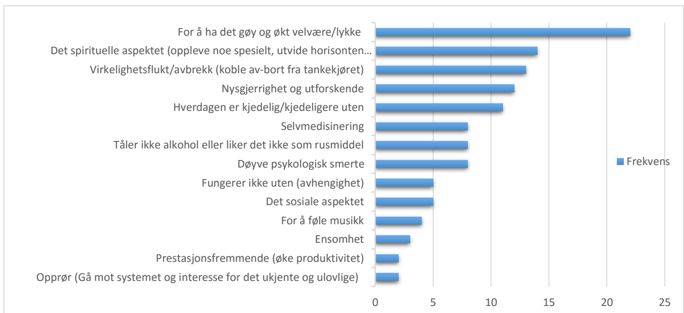
Tabell 5 Grunner til rusbruk fra forumet

Grunner til rusbruk er et komplekst spørsmål og det var sjelden at én grunn var nok til å forklare rusbruken til en person. De fleste viste altså til flere grunner for å forklare sin rusbruk. At en forklaring sjelden forklarer rusbruk alene var også et poeng hos Pedersen Tabellen under viser de 14 grunnene jeg fant, samt hvor ofte hver av dem ble nevnt gjennom diskusjonstrådene. Ut fra de 14 grunnene har jeg identifisert fire diskurser som er konstituerende for grunnene til rusbruk som finnes på diskusjonsforumet. Diskursene jeg fant har ulik grad av styrke og klarhet, og noen diskurser varierer i forhold til hvor tydelig de fremtrer. Jeg har valgt å dele diskursene