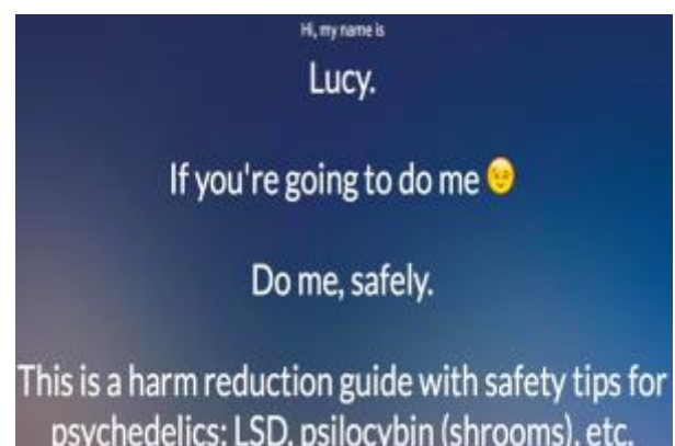
Figur 4 Nettsted for skaderedusering ved bruk av psykedelika