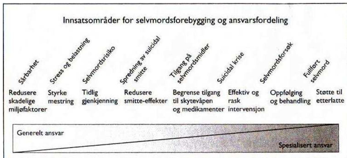
Figur 2.1 Selvmordsforebygging – innsats og ansvarsområder (Mehlum 1999 a).

Modellens øverste linje beskriver selve selvmordsprosessen fra utvikling av sårbarhet via eventuelle selvmordsforsøk, og frem til det fullførte selvmordet. På midtre linje blir det antydnet hvilke innsatsområder vi bør fokusere på for å kunne gripe inn i de ulike stadier av selvmordsprosessen. Den nederste linjen viser til hvem som i dag har et hovedansvar for å ivareta de forskjellige oppgavene, fra et generelt ansvar og over til et mer spesialisert ansvar.