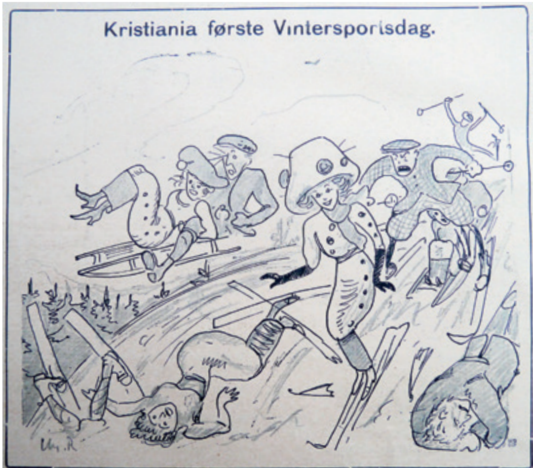
Avisene uttrykte bekymring for den skaden damenes hattenåler kunne forårsake. Også vittighetsbladene sådde tvil om hattenoten egnert seg for ferdsel i det offentlige rom.

rasker en innbruddstyv i hjemmet, og i stedet for «at skrike søgte hun at tale forbryderen til rette». Han fikk mat mot å «fremstige en takkebøn» etterpå» – og lovet å komme tilbake neste dag (Aftenposten 26. mai).