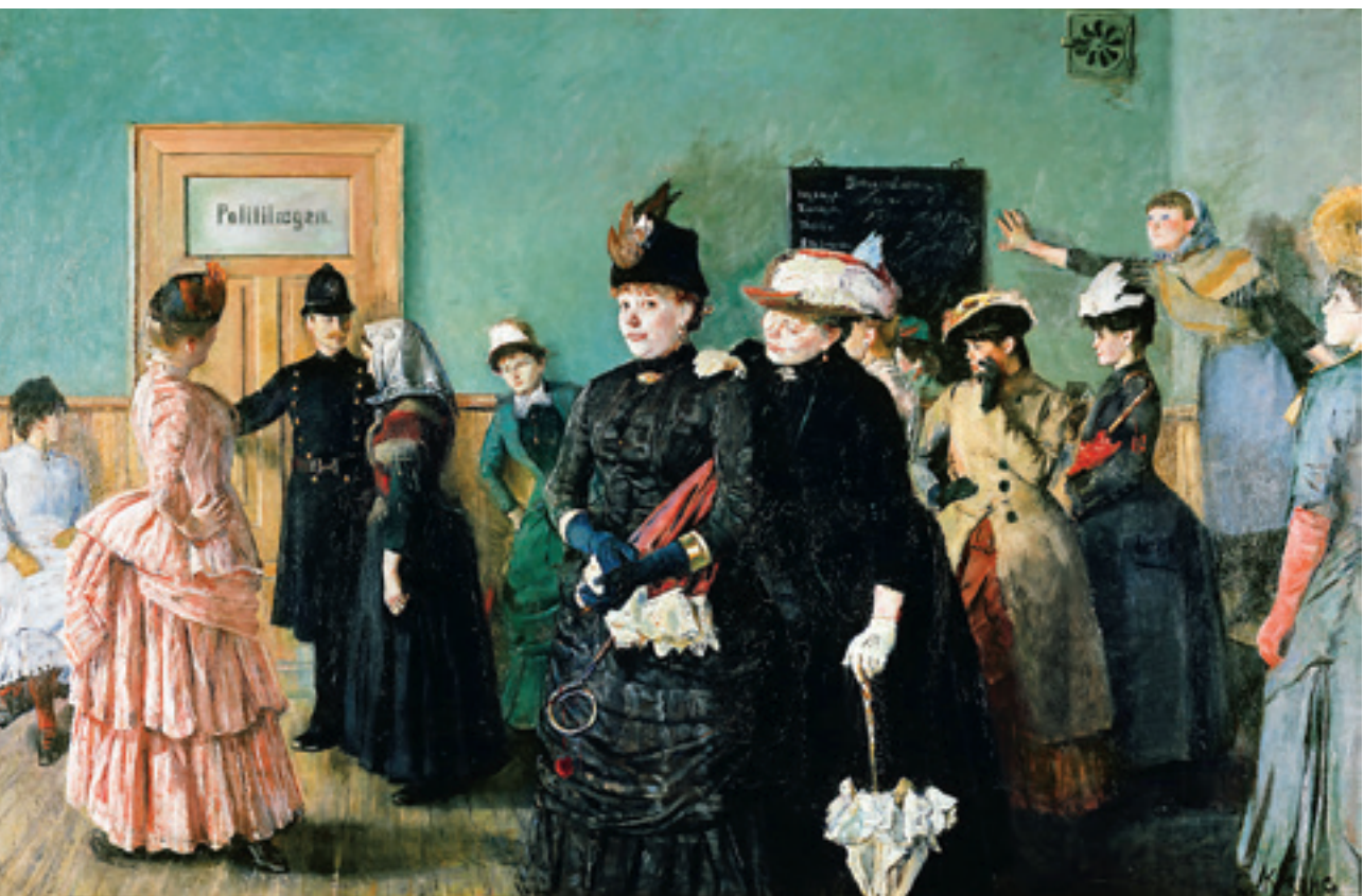
Albertine i politilægens venteværelse av Christian Krohg: Albertine er den duknakkede kvinnen som står ventende ved døren, omgitt av prostituerte i langt mer staselige kjoler. Kvinner som endte som prostituerte var relativt uvanlig rundt 1913. Dermed hadde de også nyhetsverdi for datidens presse.