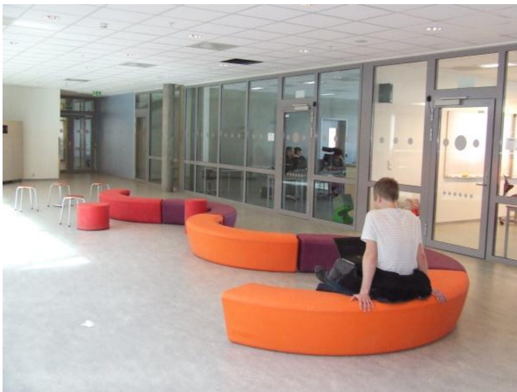
Bilde 1. Hele glassvegger mellom klasserom og fellesarealer gir betydelig utsyn og innsyn, Charlottenlund vgs.

(Ibid:13). En glassflate kan riktignok oppleves sterkest når den på grunn av lysforholdene reflekterer omgivelsene eller når det dannes speileffekter (Forty, 2000).