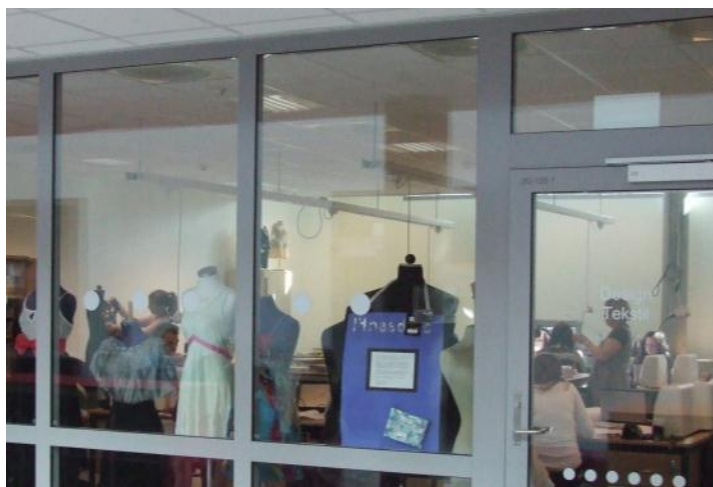
Bilde 9. Synliggjøring av aktiviteter innen design og tekstil

Omfattende bruk av interne glassvegger vil gi en visuell åpenhet som også gjør elever og ansatte mer synlige for hverandre. Å være «på utstilling» og bli eksponert for andres blikk store deler av dagen kan, som jeg har vært inne på tidligere, oppleves som både ubehagelig og slitsomt for enkelte. Men det er også en oppfatning at elevenes synlighet er positivt for skolemiljøet. Et eksempel er knyttet til Byåsen videregående skole som har store åpne arealer og stort sett glassvegger mellom klasserommene. Skoleanlegget ble hedret med Skolebyggprisen i 2004, og i juryens uttalelse argumenteres det for de åpne løsningene; «Denne åpenheten bidrar til at ingen av elevene kan gjemme seg bort. Alle blir sett – også som enkeltmennesker. De viste løsningene er etter juryens mening et godt virkemiddel mot mobbing i skolen» (Nordahl, 2004). Rambølls rapport (2008) viser at Kunnskapsløftets «krav til godt skolemiljø» kan ha generert valg av løsninger med transparente og oversiktlige lokaler. I et eget avsnitt i rapporten utdypes dette nærmere, og det blir vist til at bestemmelser om psykososialt skolemiljø i opplæringsloven kan ha vært styrende for planer som er utviklet på fylkeskommunalt nivå. I Rambølls rapport beskrives det slik;