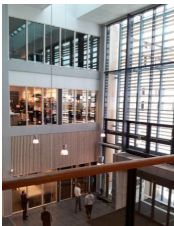
Bilde 4. Vestibyle, Hadeland vgs.