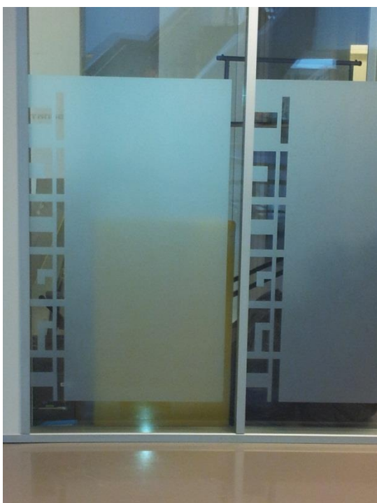
Bilde 6. Mer dekkende foliering, Tangen vgs.