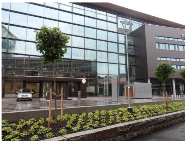
Bilde 5. Fasade, Nydalen vgs.