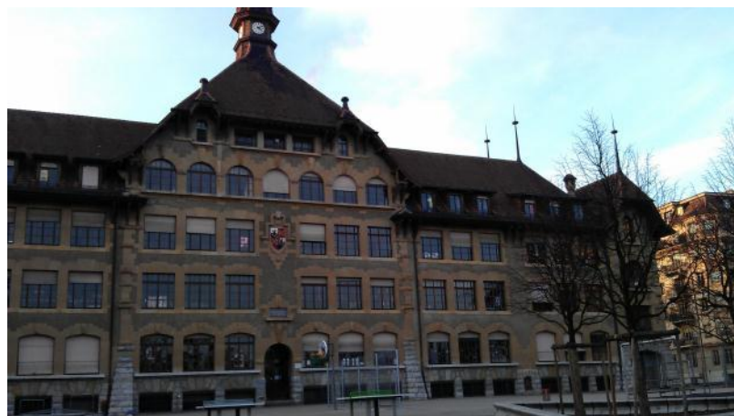
Bilde 2. Ila skole, Trondheim. Bilde 3. Sécheron skole, Genève, Sveits (1921).

Ulleberg (2002) viser til at skolegangens alvor ble understreket av at skolebyggenes arkitektoniske uttrykk hadde klare paralleller til kirkebygg (bilde 2 og 3). Disse trekkene ser man tydelig i Ila skole i Trondheim (bilde 2) som er tegnet av domkirkearkitekt Olaf Nordhagen. Rolf Grankvist, seniorforsker i lokalhistorie ved NTNU, beskriver skolen som; «En katedral av en skole med elementer av middelalder og klassiske kirkebygg, som Nidarosdomen» (Grankvist, 2011). Skolebyggene kunne fremstå i likhet med eksempelvis bankbygninger med en monumentalitet som symboliserte offentlige myndigheters betydning, ansvar og makt (Figenbaum & Nielsen, 2005). Whiteley (2003) trekker frem bankbygningers tempel- eller festningslignende utseende, og hevder at transparens ble brukt som et arkitektonisk virkemiddel for at bankene på 1980-tallet skulle fremstå mer brukervennlige i et konkurransepreget marked;