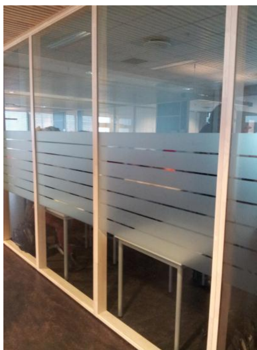
Bilde 7. Foliering reduserer inn- og utsyn

Tilstrekkelig solskjerming og blendingsmuligheter er et annet praktisk problem ved omfattende bruk av glassvegger. Problematikken ble for eksempel diskutert ved befaring på Tangen videregående skole (2011). Det nye skoleanlegget inneholder flere auditorier, men av og til er det likevel behov for lysskjerming i klasserommene. Med store glassflater internt i deler av bygget ble tilstrekkelig blending vanskelig. Men det motsatte kan også være en