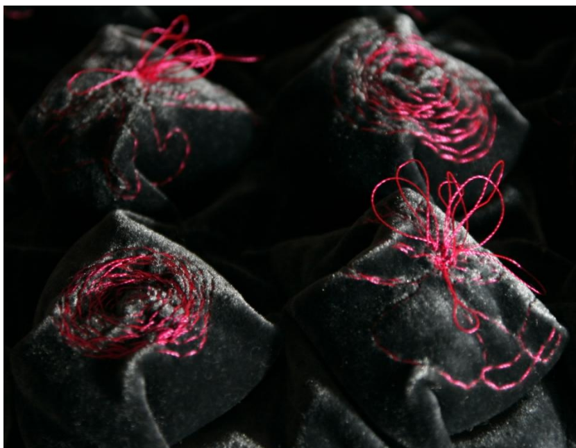
Bilde 1: Illustrasjon av utprøving av overflate med vekt på det taktile.

I utstillingen vil jeg bruke ideen om å legge vekt på sanselige aspekter ved klær ved å utforme tekstile klesobjekter. Det vil jeg gjøre ved å jobbe med kombinasjon av materialer, teknikker som skaper taktile overflater, og ved å jobbe med form og farge mot uttrykk som kan oppfattes pyntet, voldsomt og prangende og slik være et blikkfang . Målet er ikke nødvendigvis å skape funksjonelle klesplagg, men å lage en utstilling som kommenterer grensen hverdagens dresskode hos unge jenter ved å forsøke å overskride den.