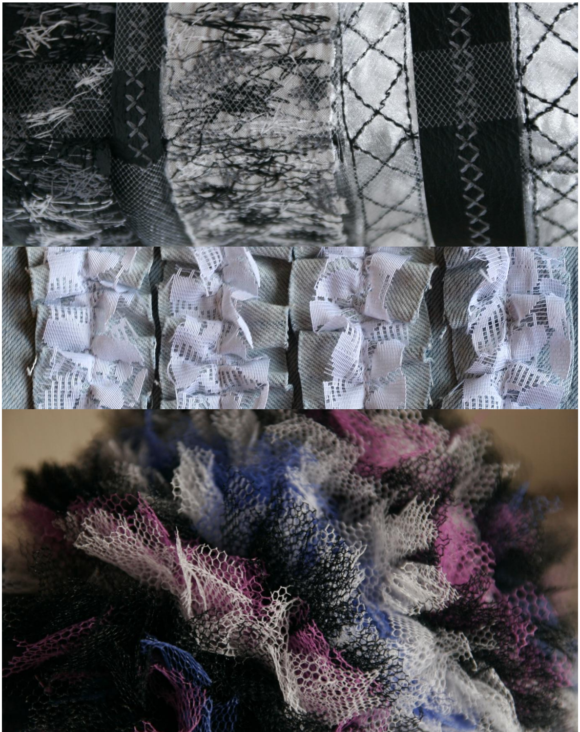
Bilde 2, 3 og 4: Illustrasjoner for å visualisere utprøvningsprosessen. Dette er bilder av prosessen mot utstillingen, og derfor ikke de endelige resultatene som skal stilles ut.